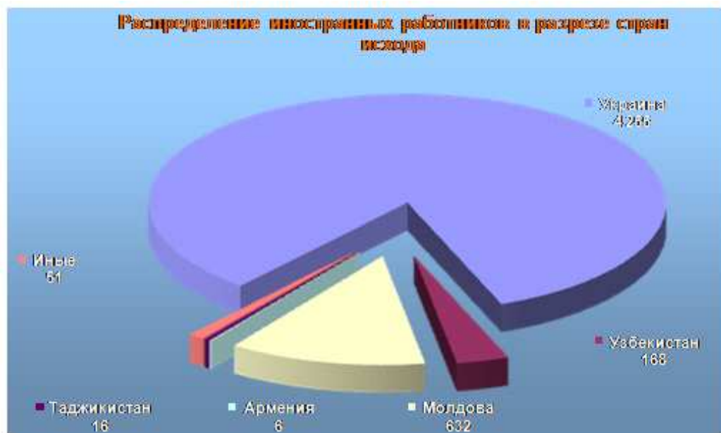
Рис. 2. Распределение иностранных работников в Белгородской области в разрезе стран исхода в 2014 г.

На иностранных граждан из стран дальнего зарубежья приходится немногим более 1% от общего числа выданных разрешений на работу. Всего на территории региона трудятся иностранные работники из 20 государств Европы и Азии.