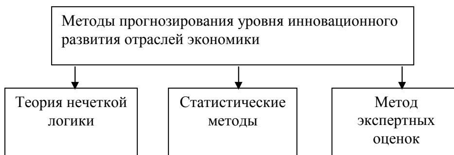
Рис. 1. Методы прогнозирования уровня инновационного развития отраслей экономики

Предложенный метод моделирования и прогнозирования уровня инновационного развития отраслей работает как с количественными данными, так и с качественными (знания экспертов), что является новой разработкой в данной области.