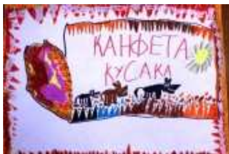
Рис. 6. Работа на тему «Фантик для конфеты» завоевала приз зрительских симпатий на страницах социальных интернет ресурсов.

По сложившейся традиции, награждение проходит на следующий день после конкурса в торжественной обстановке зала «Андеграунд» и сопровождается театрализованным представлением, подготовленным «Театром мод» ВГУЭС.