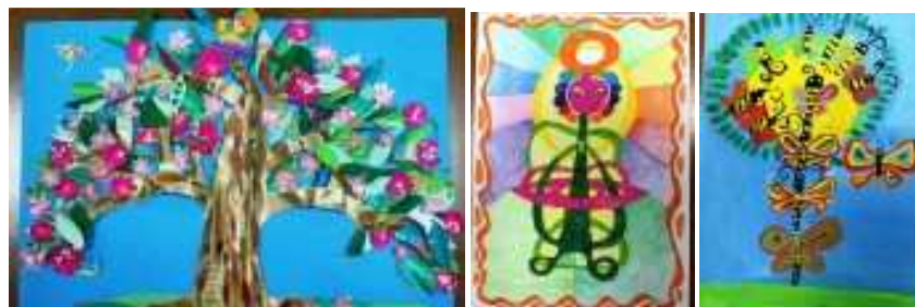
Рис. 2. Работы учащихся возрастной группы 8 – 10 лет

Ежегодно, на отборочный, заочный этап конкурса присылают работы до тысячи юных художников. Все работы интересны и своеобразны, но конкурс есть конкурс, и обязательно должны быть победители. Поэтому, во втором, очном, этапе принимают участие порядка трехсот человек.