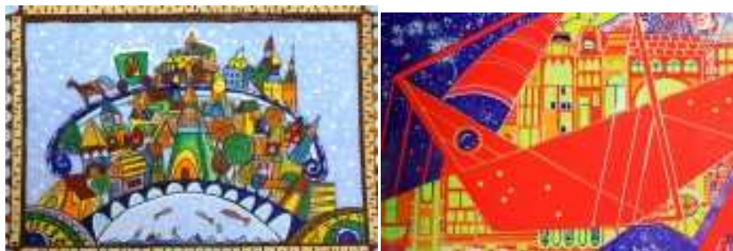
Рис. 3. Работы учащихся возрастной группы 11 – 13 лет

Второй этап приурочен к весенним школьным каникулам. Мероприятие проходит два дня в университете на кафедре ДЗТ: в первый день, участники по возрастным группам размещаются в аудитории и, в течении трех часов работают над предложенной оргкомитетом темой. Задания озвучиваются непосредственно в аудитории перед началом работы.