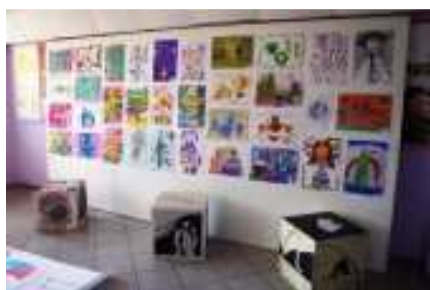
Рис.8 Выставочный стенд с работами победителей конкурса.

Лучшие работы первого и второго этапов конкурсных мероприятий в течении недели представлены на выставочных стендах университета, став своего-рода первым «звездным часом» юных талантов.