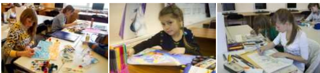
Рис. 5. Второй этап. Работа конкурсантов в аудитории

Параллельно с аудиторной работой участников конкурса, сопровождающие их педагоги и родители принимают участие в творческих на мастер-классах, организованных преподавателями кафедры дизайна и технологий.