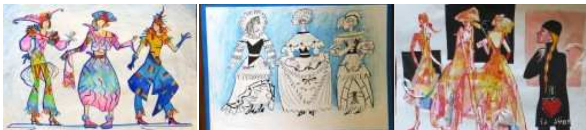
Рис. 7. Творческие работы учащихся 14–16; 17–20 лет

По сложившейся традиции, награждение проходит на следующий день после конкурса в торжественной обстановке зала «Андеграунд» и сопровождается театрализованным представлением, подготовленным «Театром мод» ВГУЭС.