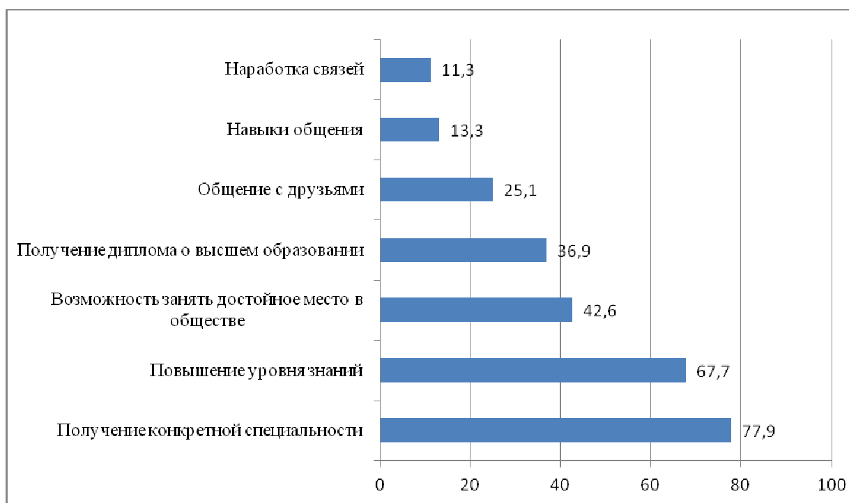
Рис. 1. Частота мнений респондентов о цели обучения в вузе, %

При оценке современных возможностей, предоставляемых медицинской академией молодым людям, подавляющее большинство выразило удовлетворение качеством получаемого образования (уровнем знаний, умений и навыков). На это указали 73,3% студентов. Теоретическая и практическая подготовка будущих врачей на старших курсах способствует дальнейшему вхождению их в профессию, становлению как специалиста и самореализации в полученной специальности в годы интернатуры. В процессе исследования также было выявлено, как студенты оценивают текущие возможности реализации в выбранной профессии (рис. 2). Полученные данные свидетельствуют о том, что две трети опрошенных довольны предоставленными возможностями и видят перспективы профессионального роста; треть респондентов удовлетворена в целом предоставляемыми возможностями работы в практическом здравоохранении и статистически не значимыми – 1,5% - оказались ответы тех, кто с трудом представляет себе сферу дальнейшей работы и не видит себя в медицине.