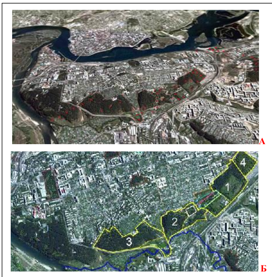
Рис. 1. Кайская гора на Ангаро-Кайском водоразделе и его зеленая зона: А – точки отпробования; Б – Зонирование Кайской рощи: 1 – Ботанический сад ИГУ; 2 – публичный парк; 3 – заповедная зона; 4 -кладбище

Ботанический сад ИГУ, предполагает реализацию на Кайской горе Ангаро-Кайского водораздела (рис. 1) идеи со 120-летней историей по созданию в городе публичного ботанического сада. Инновационный проект на 100 гектаров земли предполагает превратить Кайскую реликтовую рощу в туристическое «ядро» города, сохраняя при этом древний сосновый лес. Лесной массив Кайской горы, наряду с лесными массивами пос. Вересовка, станции Батарейной, пос. Плишкино, курорта «Ангара», Синюшиной горы, м/на Юбилейного, м/на Н.-Мельниково, водоохранной зоны Ершовского водозабора и др. зеленых массивов г. Иркутск входят в перечень лесных массивов, подлежащих строгому учету и исследованию в них состояния почв и ландшафтов в границах города. Кайская гора является уникальной природной лабораторией, отражающей историю формирования природной среды четвертичного и третичного времени – Кайским Наследием г. Иркутск. Кайская реликтовая роща, в которую входит территория Ботанического сада ИГУ и Глазковского кладбища, имеет статус памятника природы "Кайская роща".