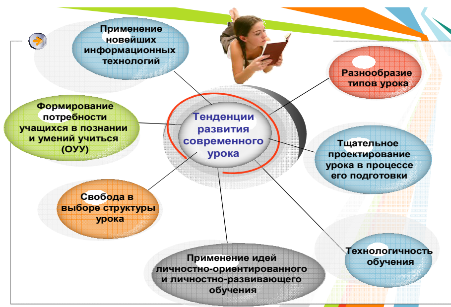
Рис. 3. Тенденция развития современного урока.

построения в инновационном режиме современного урока, обеспечивающего высокий уровень качества образования [6].