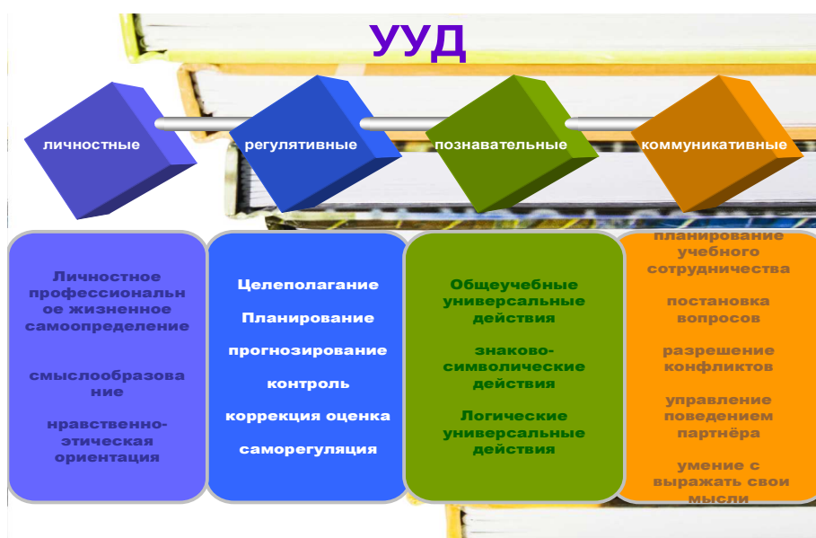
Рис. 2. Универсальные учебные действия

Следует отметить, что базовую основу ФГОС составляет формирование универсальных учебных действий. Универсальные учебные действия предусматривают развитие способности обучающегося к саморазвитию, путем осознанного и активного обретения социального опыта. Как правило, универсальные учебные действия делятся на четыре группы, каждая из которых выполняет определенную функцию (Рис.2):