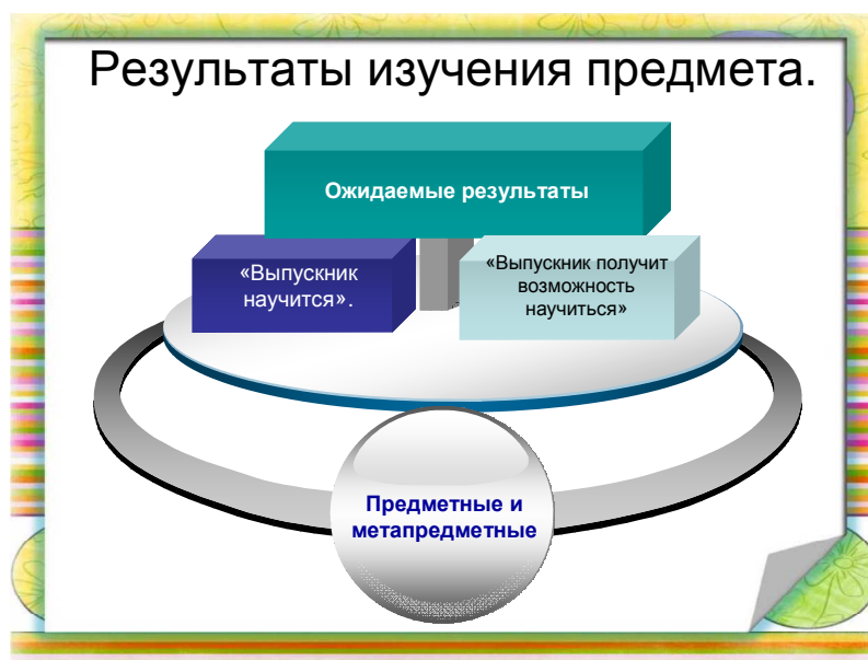
Рис. 1. Ориентация на результаты инновационного типа.

Главная особенность внедряемых в образовательный процесс ФГОС начального общего образования состоит в их ориентированности на качественные образовательные результаты (Рис.1).