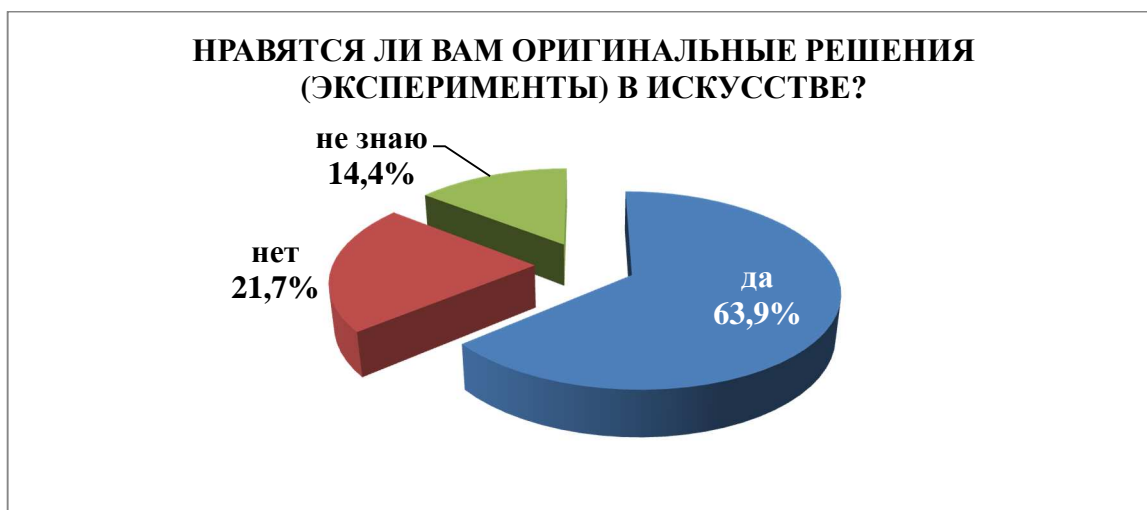
Рис.4. Отношение студентов к эксперименту в искусстве

близки и понятны 324 опрошенным (63,9 %) и не нравятся 110 (21,7 %), 73 человека (14,4 %) затруднились ответить (рис. 4).