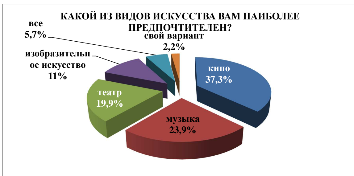
Рис. 3. Предпочтения студентов относительно видов искусства

Формируя модули будущей программы, нам было крайне важно знать о предпочтениях студентов. В частности, на вопрос: «Какой из видов театра Вам нравится больше всего?» 219 респондентов (43,2 %) выбрали драматический; 151 (29,8 %) – музыкальный; 122 (24,1 %) – экспериментальный; 15 (2,9 %) – детский. При исследовании «музыкальных пристрастий» мы выяснили следующее: наиболее близка студентам поп-музыка (130 опрошенных (25,6 %)); на втором месте – классическая (109 респондентов (21,5 %)); на третьем – инструментальная (85 (16,8 %)); на четвертом – джаз (68 (13,4 %)); на пятом – рок (58 (11,4 %)) и, наконец, на шестом – народная (57 (11,3 %)). Большая часть учащихся указала в анкетах, что им наиболее близко классическое искусство (178 (35,1 %)), нежели современное (99 (19,5 %)), или экспериментальное (38 (7,5 %)); 119 студентов (23,5 %) выбрали вариант «мне нравится всякое искусство» и, наконец, 73 респондента (14,4 %) не смогли сделать выбор. Ответы студентов на два предыдущих вопроса демонстрируют ошибочность априорного мнения общества о том, что классическое искусство чуждо молодежи, следовательно, реализуя программу, стоит быть «смелее» и не опасаться непонимания, или неприязни со стороны учащихся. Представляется, что мы несколько недооцениваем наших студентов, что может пагубно сказаться на организации воспитательной работы. В любом случае, важен диалог, построенный на принципе взаимоуважения и обоюдной заинтересованности в результате.