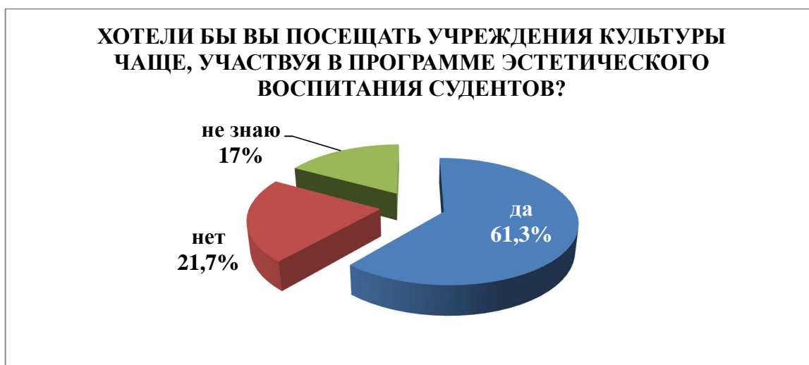
Рис.1. Заинтересованность студентов в более частом посещении учреждений культуры

Любопытно, что 288 (56,8 %) студентов предпочли посетить театр, музей, или иное учреждение культуры, нежели ночной клуб, или дискотеку, и лишь 127 (25,1 %) респондентов выбрали второй вариант; 92 (18,1 %) затруднились сделать выбор (рис. 2).