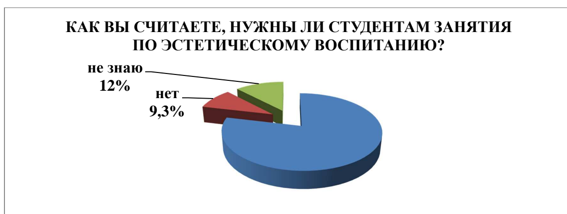
Рис.5. Отношение студентов к программе эстетического воспитания

Абсолютному большинству студентов (418 (82,5 %)) интересна история вуза, в котором они обучаются, в то же время 65 респондентов (12,8 %) дали отрицательный ответ, и 24 (4,7 %) затруднились ответить. Отраднo, что абсолютное большинство студентов – 399 (78,7 %) высказались за необходимость занятий по эстетическому воспитанию, причем только 47 (9,3 %) дали отрицательный ответ, а 61 (12 %) не определились. Таким образом, можно сделать вывод, что предложенная нами программа художественно-эстетического воспитания будущих врачей интересна учащимся и будет востребована в студенческой среде (рис. 5).