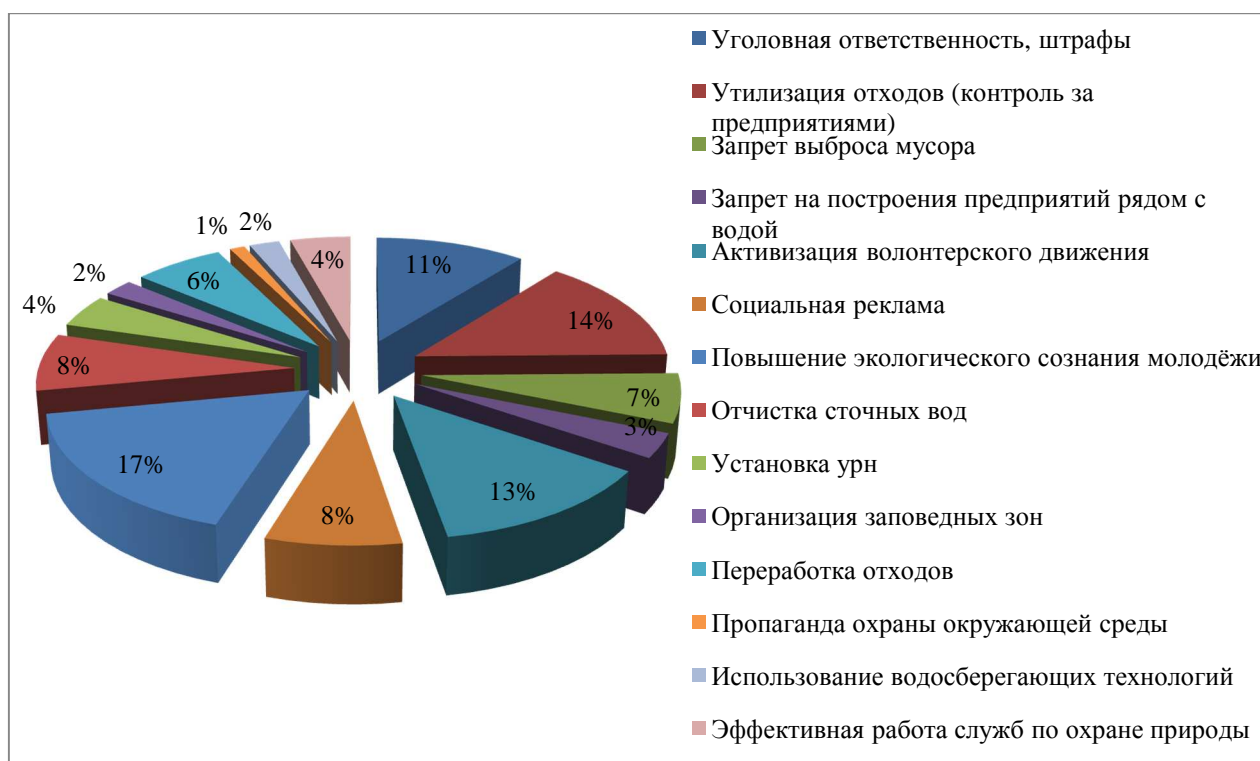
Рис. 1. Пути решения проблем загрязнения окружающей среды

Отвечая на вопрос, как решить проблемы связанные с загрязнением окружающей среды, студентами были внесены конкретные предложения, которые наглядно представлены на рис.1.