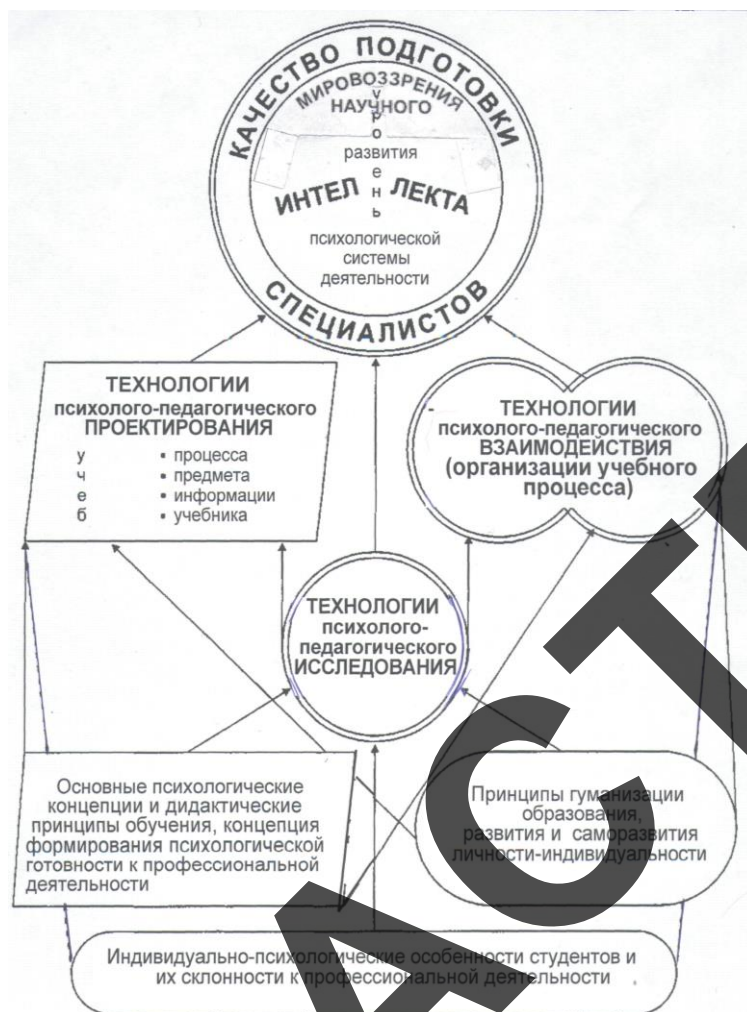
Рис.1. Концепция качества обучения, качества подготовки специалистов в системах профессионального образования

Согласно разработанной концепции (рис.1) качество обучения школьников, качество подготовки специалистов в профессиональном образовании обеспечивается при реализации в процессе обучения 3-х групп психолого-педагогических технологий: исследования, проектирования и организации учебного процесса. Реализация посредством этих технологий принципов гуманизации образования, развития, саморазвития, здоровьесбережения личности в образовательном процессе способствует развитию интеллектуальных, профессиональных, творческих способностей обучающихся. Не менее важной при этом является проблема сохранения здоровья школьников, студентов в процессе обучения, жизнедеятельности в целом.