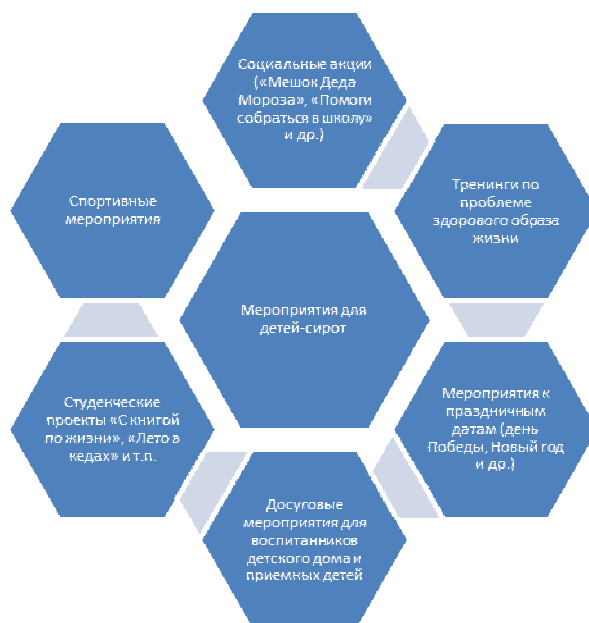
Рис. 3. Формы работы с детьми-сиротами и детьми, оставшимися без попечения родителей, организуемые студентами

В дальнейшем планируется организация и работа дистанционной школы приемного родительства, консультационного центра замещающего воспитания; педагогические десанты в сельские поселения; обобщение опыта замещающего воспитания нашей территории.