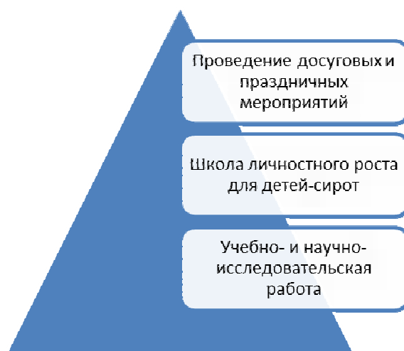
Рис. 2. Включение студентов в процесс сопровождения детей-сирот

семьях, работы с воспитуемыми разных категорий и возрастов, работы с родителями детей в воспитательной деятельности.