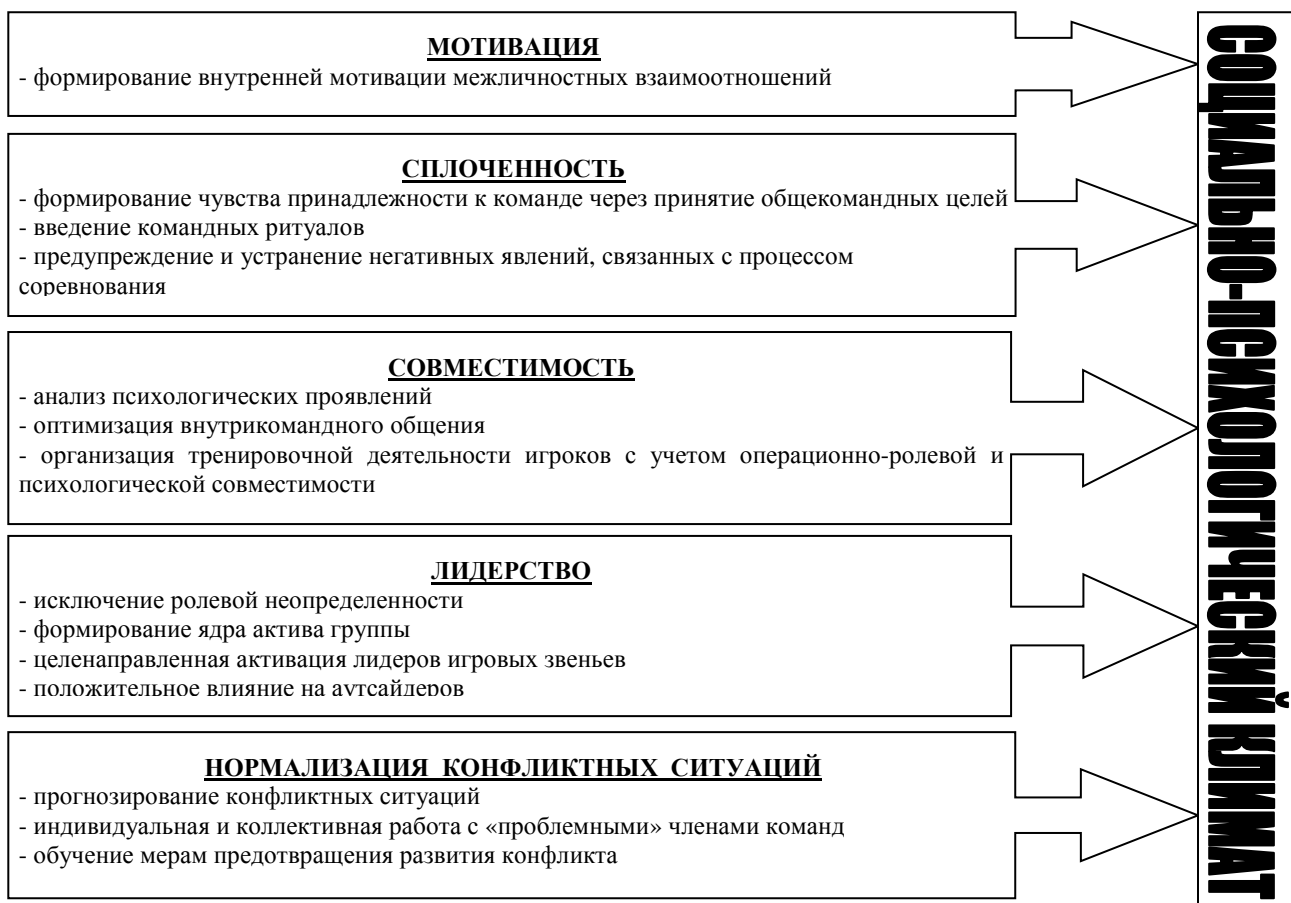
Рис. 1. Факторы, влияющие на формирование положительного социально-психологического климата в спортивной команде

Целенаправленное воздействие на указанные позиции в ходе учебно-тренировочного процесса, а также раскрытие внутреннего психологического потенциала спортсменов посредством психотренинга, способствует формированию положительного климата в спортивной команде.