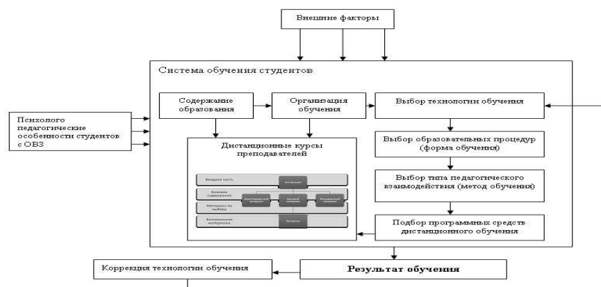
Рис. 1. Педагогическая технология дистанционного обучения

Технология обучения предполагает проектирование содержания каждой дисциплины, форм организации учебного процесса, выбор методов и средств обучения. При разработке нашей педагогической технологии мы принимали во внимание не только психолого-педагогические особенности данной студенческой группы, но и требования современных образовательных стандартов, а именно применение интерактивных и активных методов обучения [2]. Поэтому перечисленные ниже формы и методы обучения содержат ссылки на применяемые нами техники и стратегии. Некоторые из них впервые применяются при организации дистанционного обучения. На рисунке 1 представлена схема педагогической технологии дистанционного обучения студентов с ОВЗ.