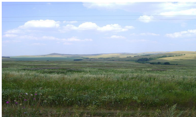
Рис. 7. Степь

пышными, высокими травами и цветами покрыта их черноземная почва, особенно по долинам и равнинам между перелесками» [2].