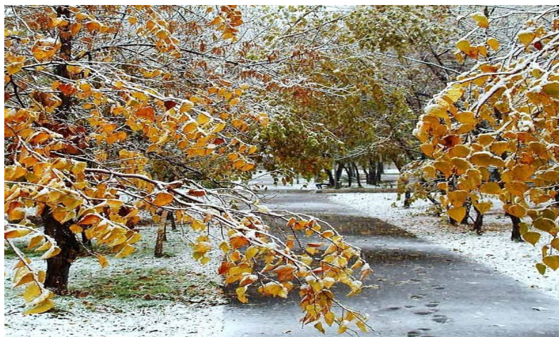
Рис. 2. Глубокая осень

«Тянулась глубокая осень, уже не сырая и дождливая, а сухая, ветряная и морозная. Морозы без снегу доходили до двадцати градусов, грязь превратилась в камни, по прудам ездили на лошадях. Одним словом, стояла настоящая зима, только без санного пути...» [1].