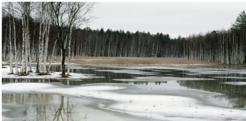
Рис. 4. Весна

сидя на задних лапках по своим сурчинам; как зазеленеют луга, оденется лес, кусты и зальются, защелкают в них соловьи...» [1].