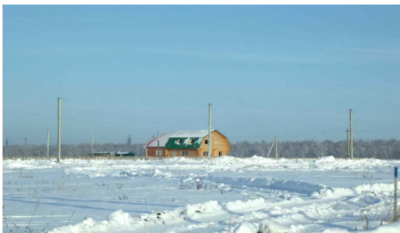
Рис. 3. Зима

...мы отправлялись по первому зимнему пути, по перевозимью, когда дорога бывает гладка как скатерть и можно еще ехать парами и тройками в ряд...» [1].