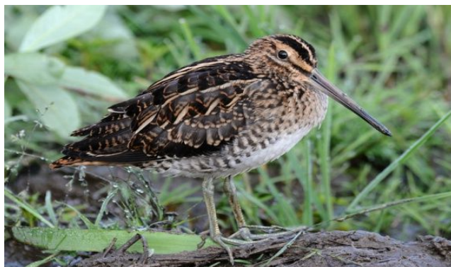
Рис. 5. Бекас

«Все хорошо в природе, но вода – красота всей природы. Вода жива; она бежит или волнуется ветром; она движется и дает жизнь и движение всему ее окружающему. Разнообразны явления вод, и непонятны законы этого разнообразия. Из вершины высокой, первозданной горы, сложенной из каменного дикого плитняка, бьет светлая, холодная струя, скачет вниз по уступам горы и, смотря по ее крутизне, образует или множество маленьких водопадов, или одно, много два, большие падения воды. Если она сжата камнями, то гнется узкою лентою; если катится с плиты, то падает широким занавесом; если же поверхность горы не камениста и не крута, то вода выроет себе постоянное небольшое русло – и как все живо, зелено и весело вокруг него!» [2].