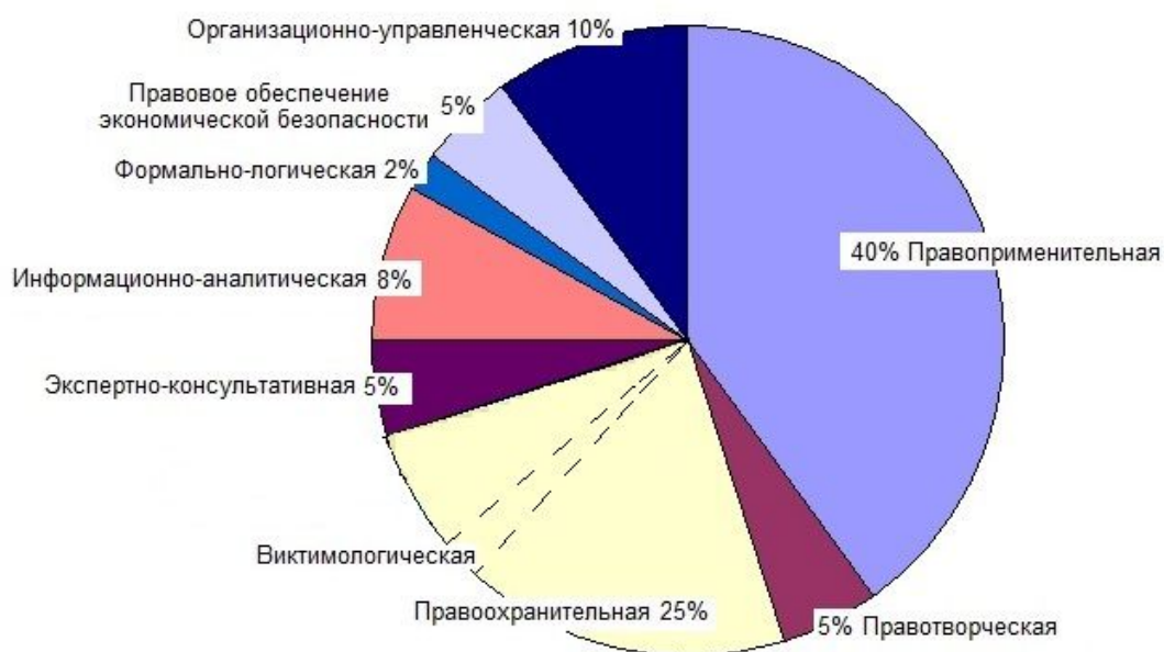
Рис. 2. Составляющие профессиональной деятельности юристов гражданско-правового профиля

характеристики 1 этих специалистов и действующие вузовские образовательные стандарты для профессиональной подготовки данных специалистов в вузе 2 .