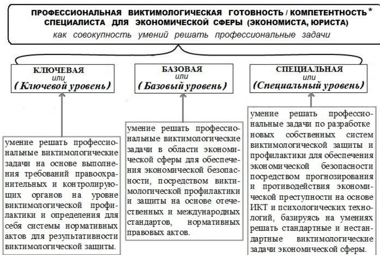
Рис. 1. Содержание и уровни профессиональных виктимологических задач экономической сферы

К составляющим профессиональной виктимологической готовности мы относим теоретические знания, технологические умения, навыки и профессиональные качества, личностные и мотивационные качества. Соответственно, концепция формирования профессиональной виктимологической готовности современного специалиста для экономической сферы, на наш взгляд, должна быть основана на принципах обучения, способствующих овладению умениями решать профессиональные задачи и проблемы экономической сферы путем использования метода целесообразно подобранных задач [16], соответствующих виду профессиональной деятельности, в частности, виктимологической на ключевом, базовом и специальном уровне (см. Рис.1).