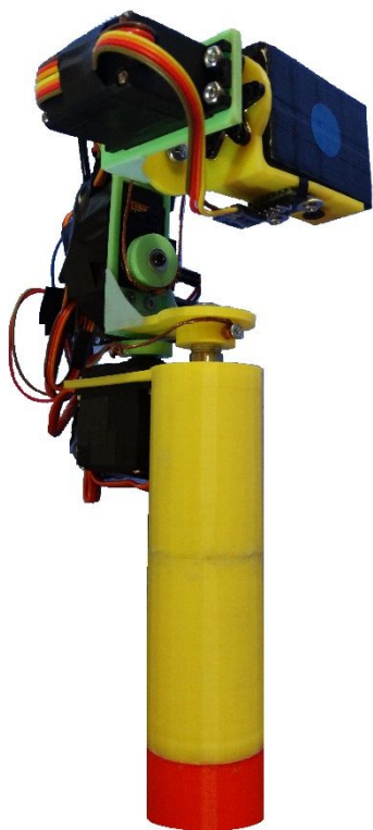
Рис. 3. Действующий макет трехосного стабилизатора фотокамеры

Учебная практика 2, проводимая на втором курсе по направлению 12.03.01 – Приборостроение, направлена на профессиональную подготовку в области электротехники. На базе Томского индустриального техникума студенты получают рабочую профессию «Электромонтер» 3-4 разряда, на базе экономико-промышленного колледжа рабочую профессию слесаря КИПиА или радиомонтажника 3-4 разряда. Таким образом, к моменту