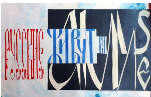
Павленко Е.А. «Русские», 2015 г.