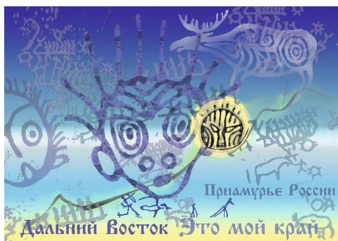
Павленко Е.А. «Приамурье», 2016 г.