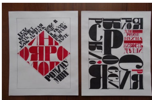
Филиппова Е.Е. «Моя Родина – Россия», 2015 г.