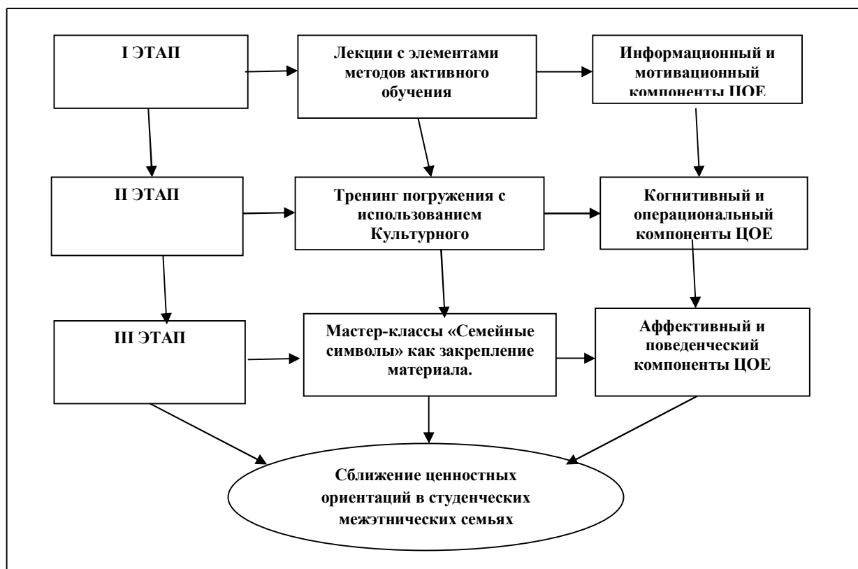
Рис. 1. Схема программы психолого-педагогического обеспечения условий сближения ценностных ориентаций супругов в студенческих межэтнических семьях

Обратная связь от студентов, участвовавших в апробации данной программы, показала, что в процессе лекционного курса повышаются информационный и мотивационный компоненты ценностно-ориентационного единства (ЦОЕ): обнаруживается положительное отношение к семье и семейным ценностям. В процессе тренинга повышаются когнитивный и операциональный компоненты ЦОЕ: развиваются положительные межличностные отношения между участниками, повышается толерантность, снижается дистантность. Культурный ассимилятор способствует выработке принятия и понимания партнера, позитивному настрою на другого, положительному отношению к себе, снижению социальной дистантности, повышению положительного отношения к межэтническим семьям. В процессе проведения мастер-классов повышается аффективный (эмоционально-волевой) компонент: повышается эмоциональный настрой участников, увеличивается сплоченность (рис. 1).