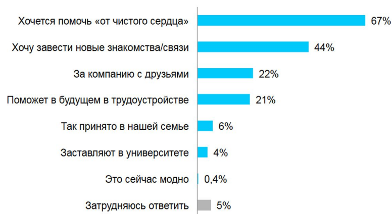
Рис. 3. Мотивы участия студентов в волонтерской деятельности [4]

Если обратим внимание на личностные характеристики добровольцев, к которым исследователь У.П. Косова относит следующие: предрасположенность к сопереживанию человеку, нуждающемуся в помощи; внутренний локус контроля, сострадательность,