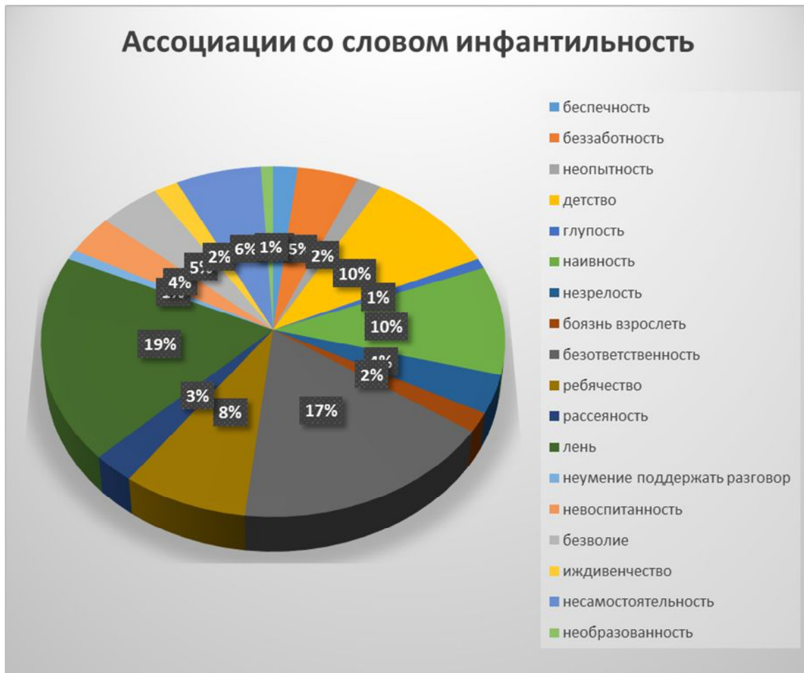
Рис. 1. Диаграмма ассоциаций со словом «инфантильность» у студентов ВГУЭС

безответственность (20,9%), ребячество (9,9%), рассеянность (3,3%), лень (23,1%), неумение поддержать разговор (1,1%), невоспитанность (4,4%), безволие (5,5%), иждивенчество (2,2%), несамостоятельность (7,7%), необразованность (1,1%) (рис. 1).