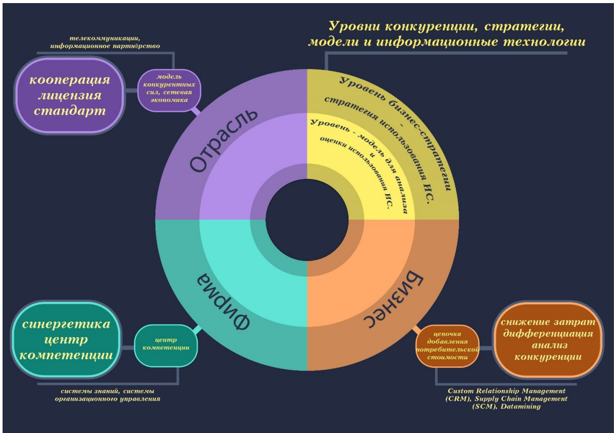
Рис. 2. Инфографика – Уровни конкуренции, стратегии, модели и ИТ