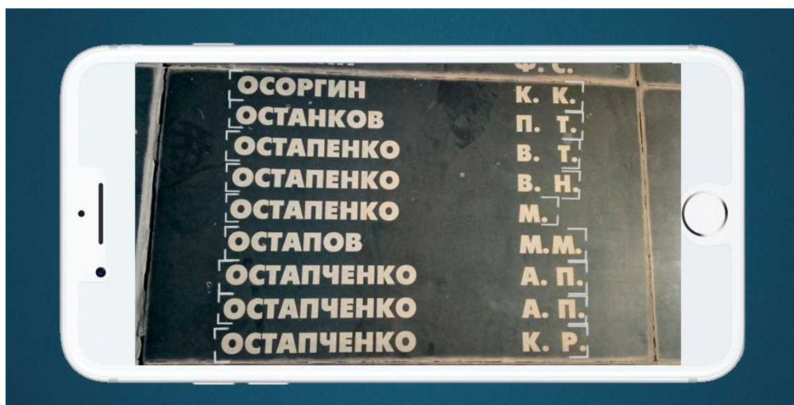
Рис. 2. Макет «Плиты»

На рис. 2–3 демонстрируется захват маркеров-фамилий увековеченных героев, для последующего их распознавания. Для отображения информации об участнике войны нужно выбрать его фамилию.