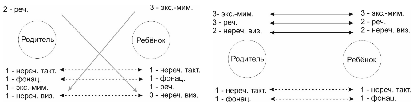
Рис. 3. Сравнительная схема изменения коммуникативного взаимодействия после коррекционного воздействия (до – слева, после – справа). Примечания: те же, что и к рис. 1

После проведения логопедической диагностики родителям были даны рекомендации и составлен план коррекционной работы по преодолению отклонений в овладении речью. Нам удалось отследить динамику как в речевом развитии ребенка, так и в особенностях диалога «взрослый — ребенок» на примере второго случая. Результаты наблюдения представлены на рисунке 3.