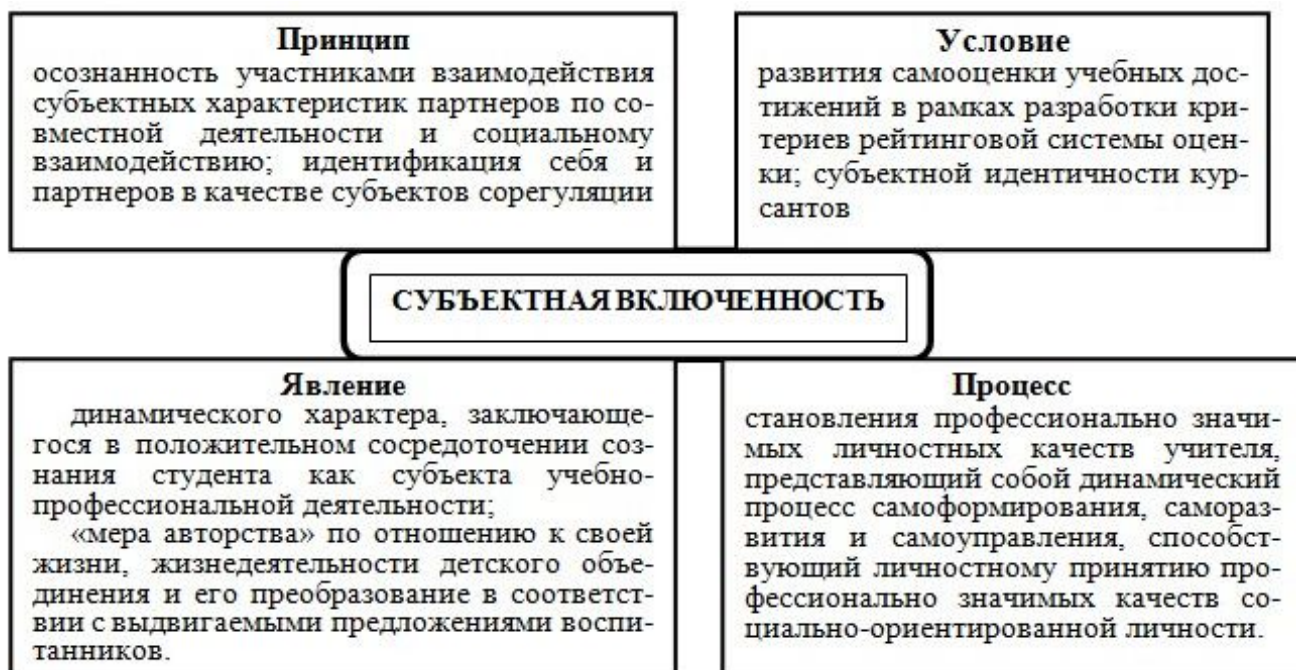
Рис. 2. Многоаспектность понятия «субъектная включенность»

Следовательно, субъектная включенность бакалавра – это процесс становления субъектной позиции и субъект-субъектных отношений в учебно-профессиональной деятельности, обеспечивающий саморазвитие и самовоспитание значимых качеств личности.