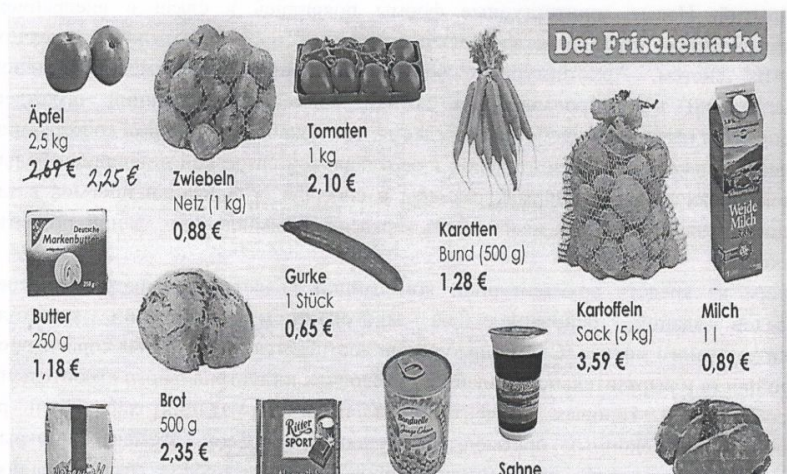
Рис. 3. Пример упражнения на создание ролевого диалога

Übung 14. Sie gehen mit ihrer Freundin/ ihrem Freund ins Geschäft, um Lebensmittel für die nächste Woche zu kaufen. Besprechen Sie, was Sie brauchen und machen Sie eine Liste. Spielen Sie danach einen Einkaufsdialog im Geschäft.