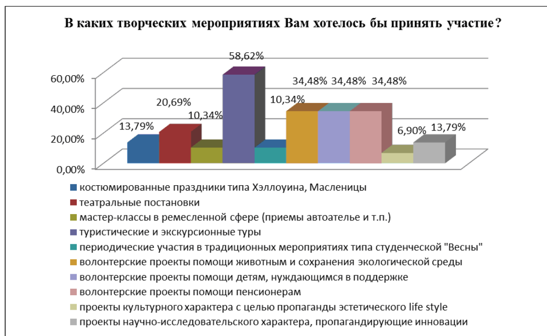
Рис. 3. Диагностика предпочтений выбора творческих мероприятий для участия

Наибольший энтузиазм у молодежи вызвал туризм и экскурсионные туры, их отметили более половины опрошенных (58,62%). Инновациями заинтересовались лишь 13,79% студентов. Согласно поработать волонтерами всего 34,48% выборки (многие из проголосовавших за волонтерство выбирали сразу несколько его направлений). Обучение ремеслу тоже не вдохновило основную массу молодых людей, только 10,34% выразили желание провести таким образом свой досуг.