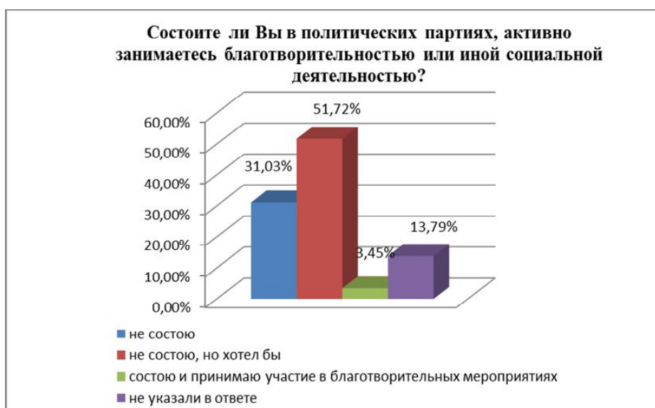
Рис. 5. Уровень социально значимой активности студенческой молодежи г. Воронежа

По собственной инициативе занимают активную социальную позицию только 3,45% студентов (рисунок 5). Высокий уровень духовно-нравственной культуры среды предполагает формирование аргументированной гражданской позиции членов общества, участие в социальной жизни, в частности оказание поддержки наиболее уязвимым группам населения, сохранение природных ресурсов и иную заботу об окружающем мире.