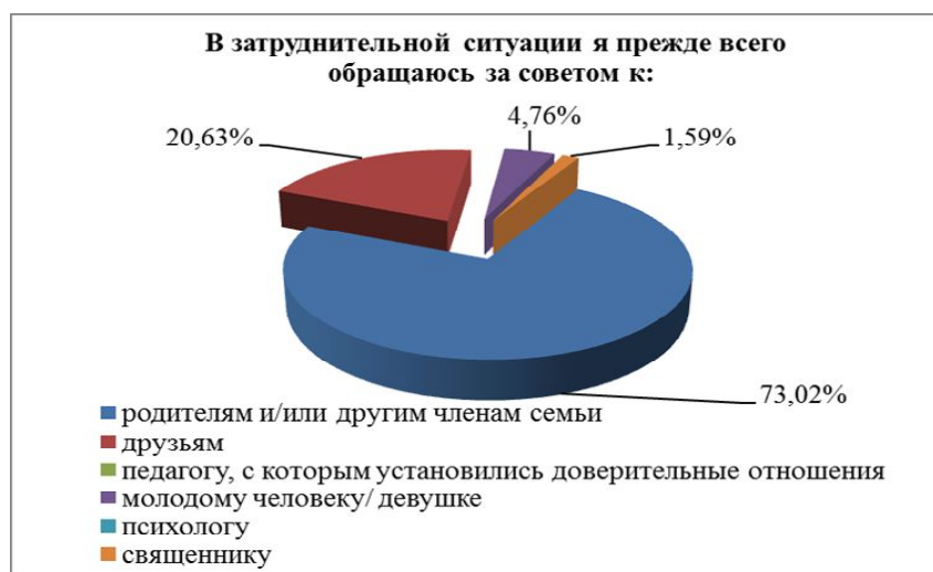
Рис. 2. Предпочтения в выборе жизненного наставника студентами

В вопросе выбора жизненного наставника 73% студентов обратятся за поддержкой к родителям или другим членам семьи. Друзьям свои проблемы доверят 20,63% опрошенных и только 4,76% будут искать помощи у сердечного друга (молодого человека или девушки). Удивительно, но ни один опрошенный не выбрал в качестве жизненного наставника священника и педагога, с которым установились доверительные отношения (рисунок 2).