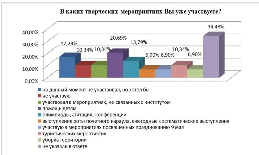
Рис. 4. Диагностика активности участия в творческих мероприятиях (открытый вопрос, студенты самостоятельно называли мероприятия)

По собственной инициативе занимают активную социальную позицию только 3,45% студентов (рисунок 5). Высокий уровень духовно-нравственной культуры среды предполагает формирование аргументированной гражданской позиции членов общества, участие в социальной жизни, в частности оказание поддержки наиболее уязвимым группам населения, сохранение природных ресурсов и иную заботу об окружающем мире.