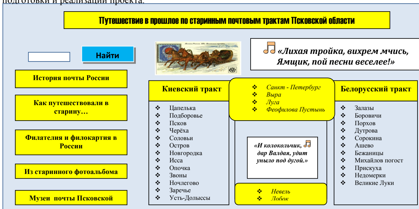
Макет сайта «Почтовые станции Псковской области»

5) эффективное взаимодействие со средствами массовой информации в процессе подготовки и реализации проекта.