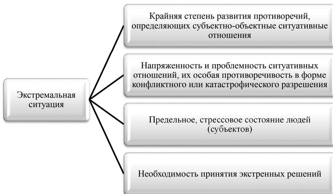
Рис. 1. Компоненты дефиниции «экстремальная ситуация»

Представляют интерес исследования П.С. Карако, Д.Д. Зербино, которые считают, что понятие «экстремальная ситуация» должно быть рассмотрено в контексте сущностных компонентов [3], содержание которых представлено на рисунке 1.