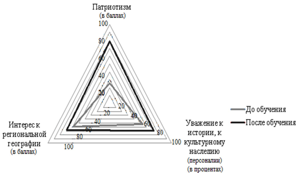
Рис. 2. Динамика компонентов региональной идентичности учащихся экспериментального класса в результате применения историко-персоналогического подхода

Контролирующий этап педагогического эксперимента в целом показал достаточную эффективность историко-персоналогического подхода для повышения уровня региональной идентичности: патриотизма, интереса к региональной географии и персоналиям. Результаты проверялись с помощью анкетирования, включающего три блока, соответствующих компонентам региональной идентичности (рис. 2).