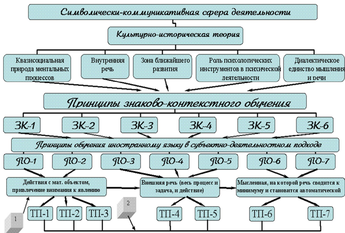
Рис. 2. Схема выстраивания логики теоретических этапов формирования образовательной деятельности с участием студента как субъекта в данном процессе

Пояснение. 1 – теория планомерного формирования умственных действий; 2 – методические приемы, используемые в соответствии с выработанной последовательностью: набор действий и аффективных реакций при получении знаний (1), дискутирование (2), задание по определенной тематике (3), вербализация внешней речи (4), диалогическая речь в процессе объяснения материала (5), создание игровых ситуаций (6), решение задач в одном контексте (7). Следующим важным условием выстраивания схемы выступает знаково-контекстное обучение. Для студента образовательная деятельность, которая ведется в соответствии с принципами: моделирование на занятиях целостного содержания и профессионального контекста (1), связь теории и практики (2), кооперация (3), активная позиция (4), преодоление трудностей (5), единство обучения и воспитания (6) – является основной возможностью превращения материальных форм деятельности в мысленные формы деятельности.