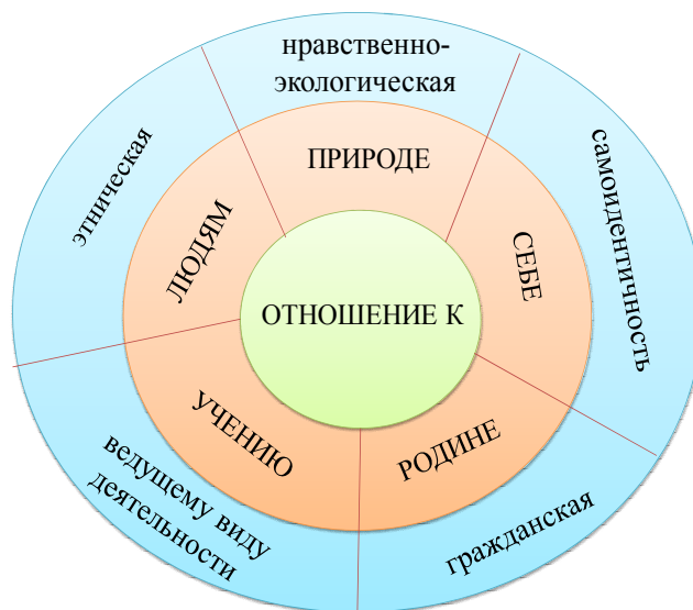
Рис. 1. Идентификационная структура студента [14]

Механизм гражданской идентификации предполагает последовательное освоение студентами: а) на уровне группы – групповых (социальных) норм и ценностей поведения, б) на уровне нации – национальной культуры, способности и потребности сохранять и укреплять национально-культурное единство общества, в) на глобальном уровне – формирование гражданина мира.