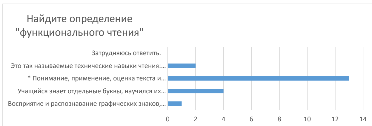
Диаграмма 1. Количественное соотношение ответов на первый вопрос

Выводы: правильно определили понятие «функциональное чтение» 65% респондентов. В современных научных публикациях понятие «функциональное чтение» стало синонимом функциональной грамотности чтения, которое определено исследованием PISA. Однако надо обратить внимание, что 35% респондентов не могут дать правильное определение.