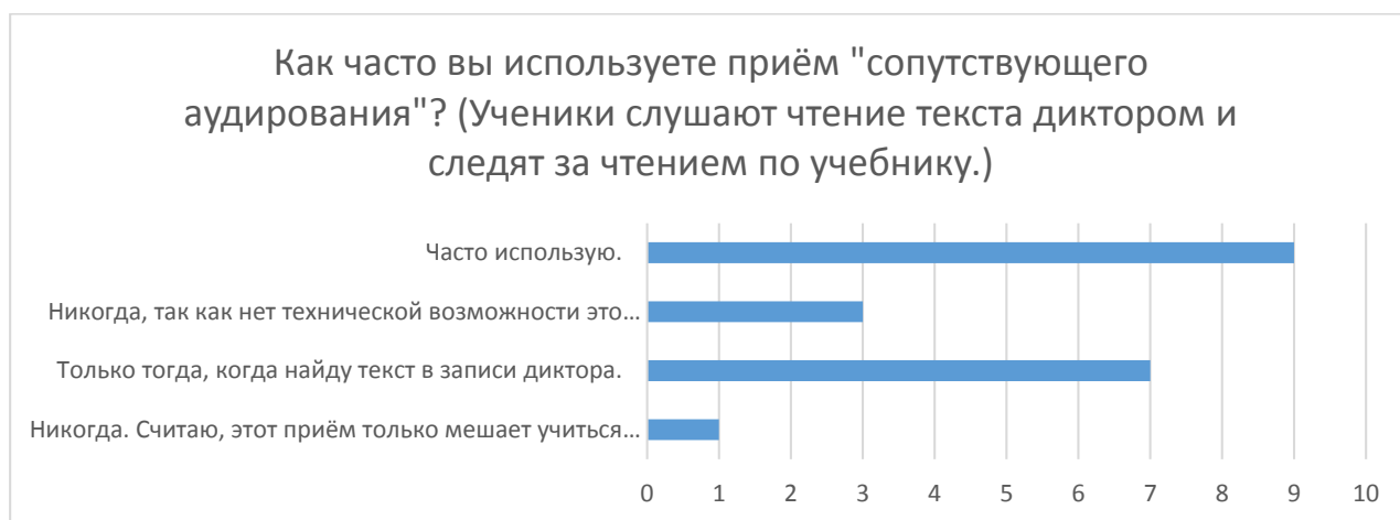
Диаграмма 3. Количественное соотношение ответов на третий вопрос

Выводы: как видно из диаграммы, приём «сопутствующего аудирования» [1, с. 330] часто используется учителями. Только один педагог считает, что этот приём мешает учиться читать. Если есть техническая возможность, то этот приём использует большинство учителей.