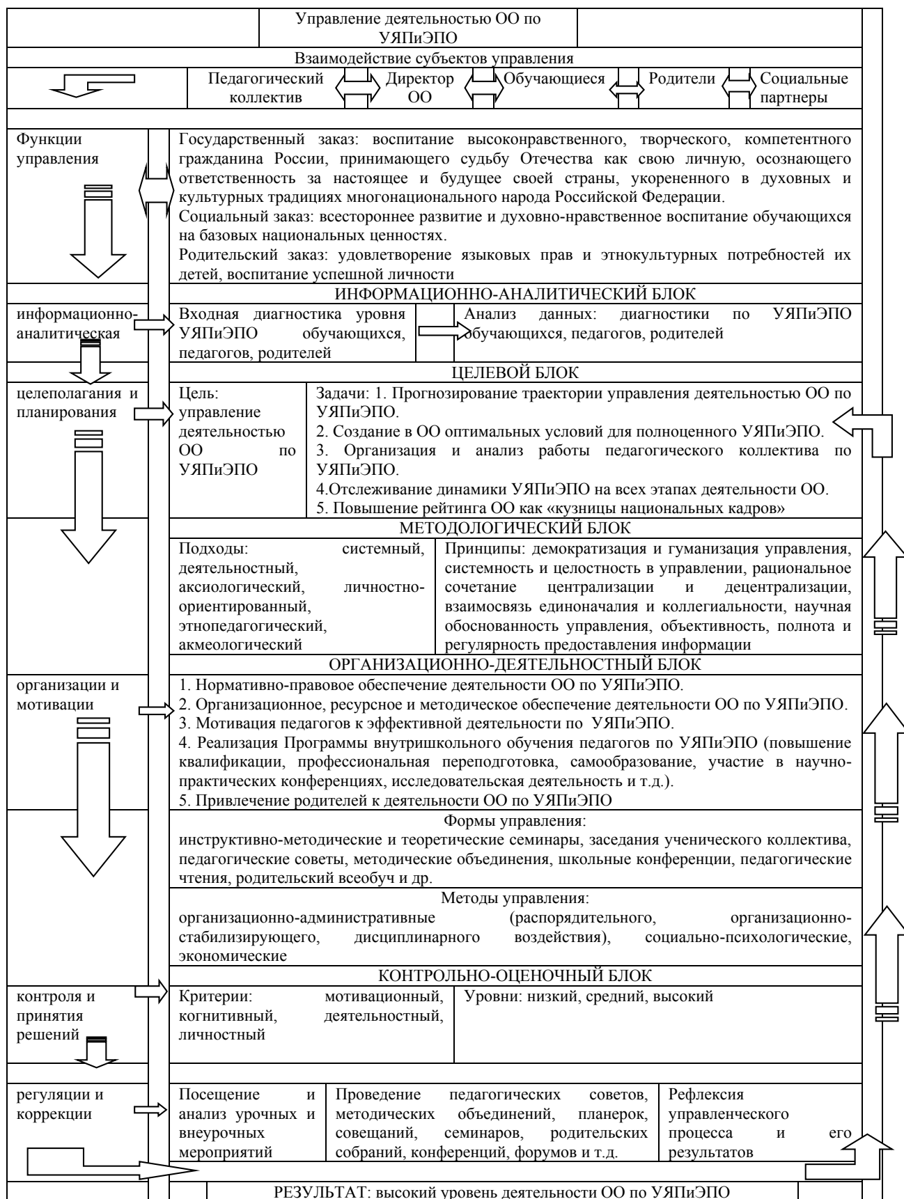
Рис. 1. Модель управления деятельностью ОО по удовлетворению УЯПиЭПО