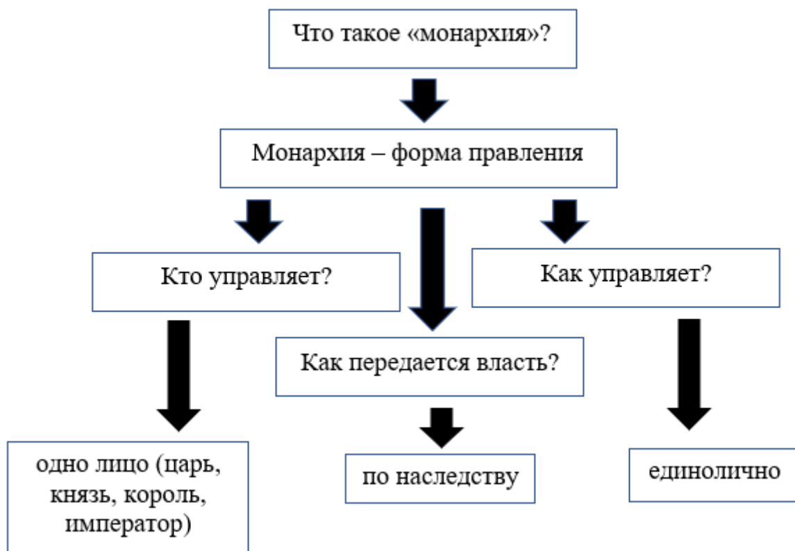
Рис.1. Работа с понятием

В образовательном процессе при формировании исторических понятий на уроке учитель должен использовать разнообразные формы работы. Важной формой деятельности является работа с текстом учебника. При работе с учебником могут быть достигнуты следующие результаты. Например, по окончании 5-го класса обучающиеся должны уметь вычленять главную мысль во фрагменте текста, уметь ориентироваться в содержании учебника, используя оглавление, уметь пересказывать, используя иллюстрации и изображения, уметь составлять простой план текста. В 6-м классе обучающиеся должны освоить умение выделять существенное содержание в параграфе, уметь пересказывать, используя нескольких источников, уметь рассматривать вопрос в развитии. Обучающиеся 7-го класса должны демонстрировать умение излагать материал на основе нескольких параграфов, уметь строить план сложного типа. Ученики 8-го и 9-го классов должны демонстрировать умение приводить доказательства к выводу, сформулированному учителем, уметь составлять план темы, уметь самостоятельно формулировать понятия и термины, уметь сравнивать и соотносить тексты двух и более учебников.