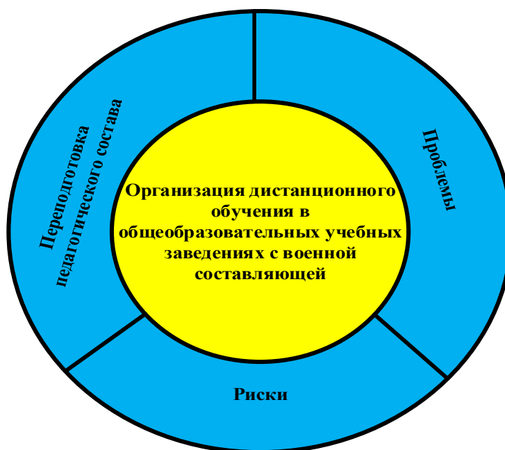
Рис. 2. Организация дистанционного обучения с учетом специфики образовательных организаций с военной составляющей

Структура организации дистанционного обучения из-за специфики образовательных организаций с военной составляющей представлена на рисунке 2 [4].