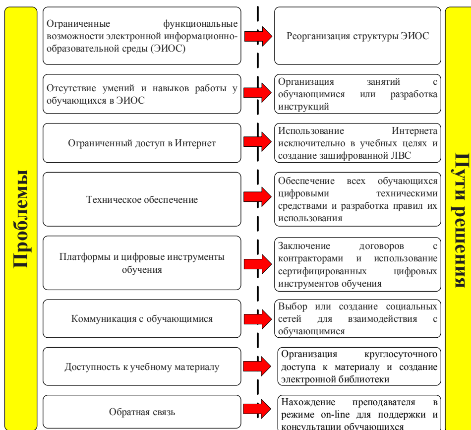
Рис. 4. Проблемы в организации дистанционного обучения из-за специфики образовательных организаций с военной составляющей

Проблемами и путями их решения могут быть [5]: