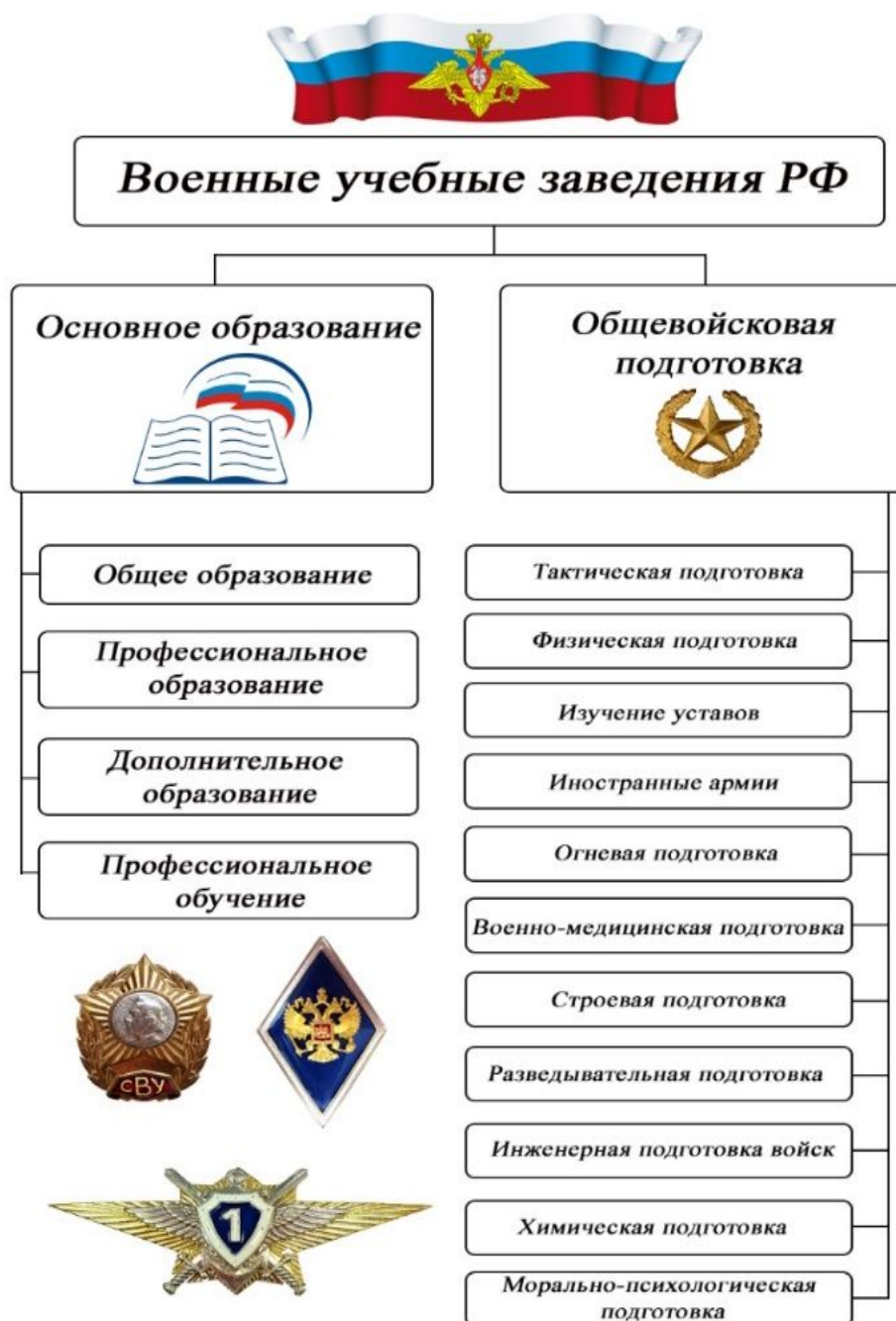
Рис. 1. Общевоинская подготовка в образовательных организациях с военной составляющей

Основное образование в образовательных организациях с военной составляющей включает: общее образование, профессиональное образование, дополнительное образование. Изучение военных дисциплин несет в себе практическую значимость, благодаря которой обучающиеся постигают и отрабатывают военные навыки под руководством офицерского состава. Следовательно, традиционный формат является основополагающим в образовательных организациях с военной составляющей.