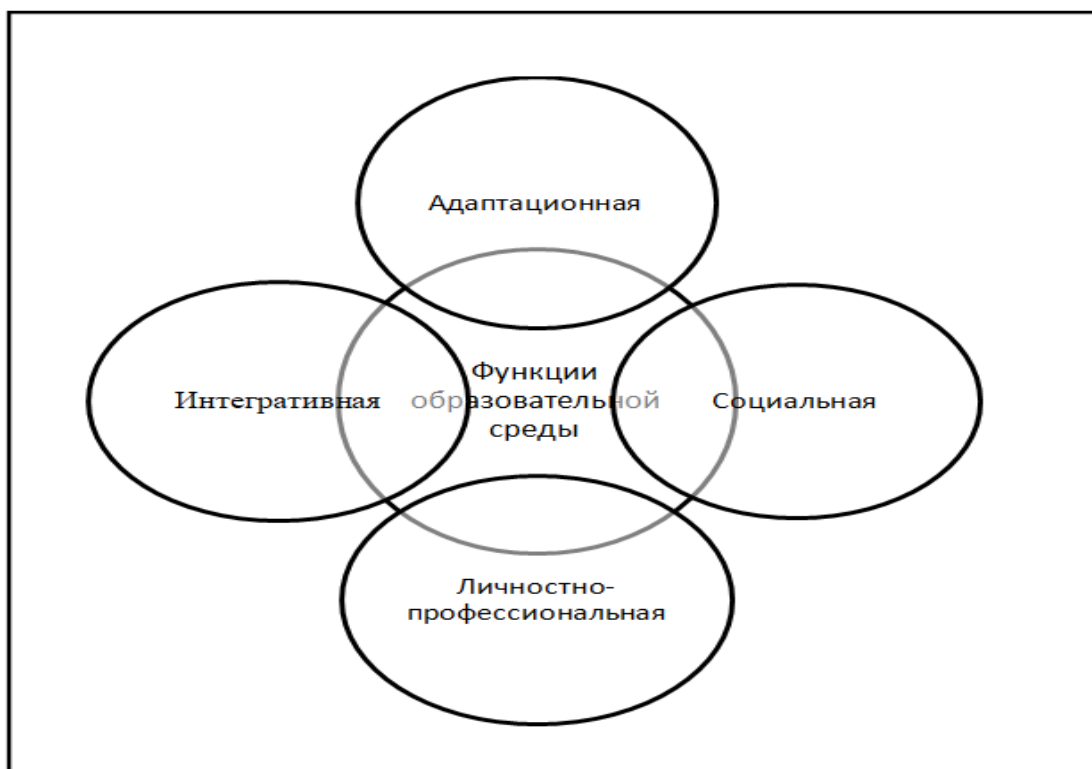
Рис. 1. Функции образовательной среды (по А.И. Артюхиной)

1. Адаптационная. Образовательная среда вуза обеспечивает эффективные и оптимальные условия для приспособления обучающегося к образовательному процессу. Для реализации данной функции важно учитывать сами условия приспособления, которые являются новыми для субъекта обучения.