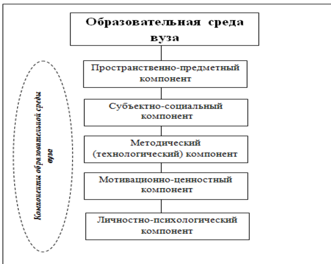
Рис. 2. Структура образовательной среды вуза