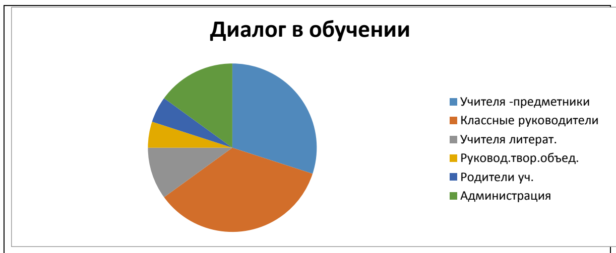
Рис. 2. Респонденты, принявшие участие в тестировании, анкетировании, беседах, опросах, формирующем педагогическом эксперименте по проблеме: «Формирование речевой компетенции методом учебного диалога»

Результаты исследования и их обсуждение. Основные выводы по проблеме исследования доложены и обсуждены на областной конференции (2018 г.), международной конференции (Казань – Уральск, 2018, 2019 гг.), в докладах автора на семинарах, международной конференции (Россия, Казахстан, Молдавия, Украина 25.11.2020 г.).