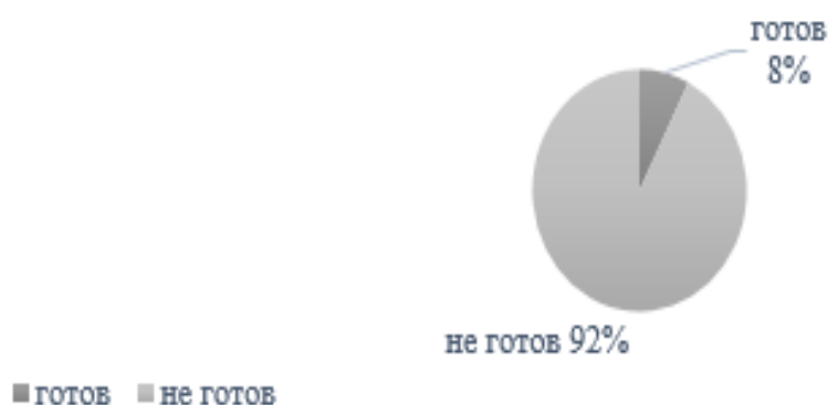
Рис. 3. Готовность педагога к профилактике рисков школьной неуспешности по тактическому критерию

Диагностика по тактическому критерию по количеству профессиональных связей педагогов проводилась методом сетевого анализа, который показал, что педагоги не имеют профессиональных связей, не работают как полипрофессиональная команда и не готовы к супервизии. Результаты показали готовность 8% педагогов к профилактике рисков школьной неуспешности (рис. 3).