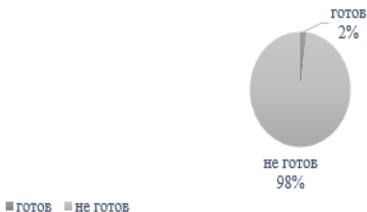
Рис. 4. Готовность педагогов к профилактике рисков школьной неуспешности по технологическому критерию

Для выявления актуальных дефицитных компонентов готовности построили рейтинг готовности педагогов к профилактике рисков школьной неуспешности исходя из результатов проведенных диагностик (табл. 2).