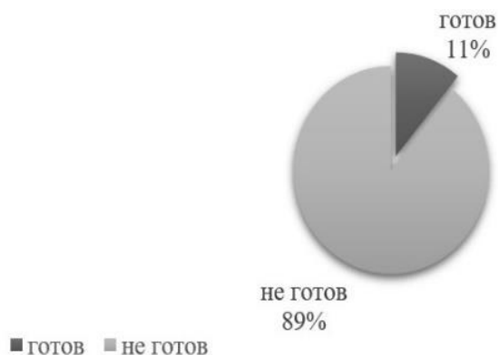
Рис. 5. Актуальное состояние готовности педагогов к профилактике рисков школьной неуспешности

В результате проведенного диагностическими методами исследования определено, что готовность педагогов к профилактике рисков школьной неуспешности двух школ малого города Красноярского края составляет всего 11%.