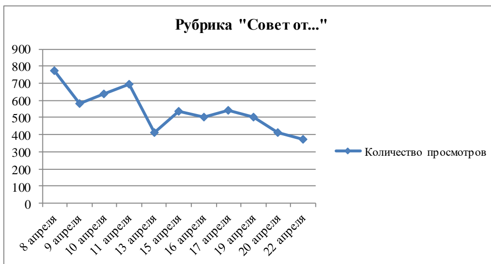
Рис. 2. Анализ интереса иностранных студентов к интерактивным рубрикам