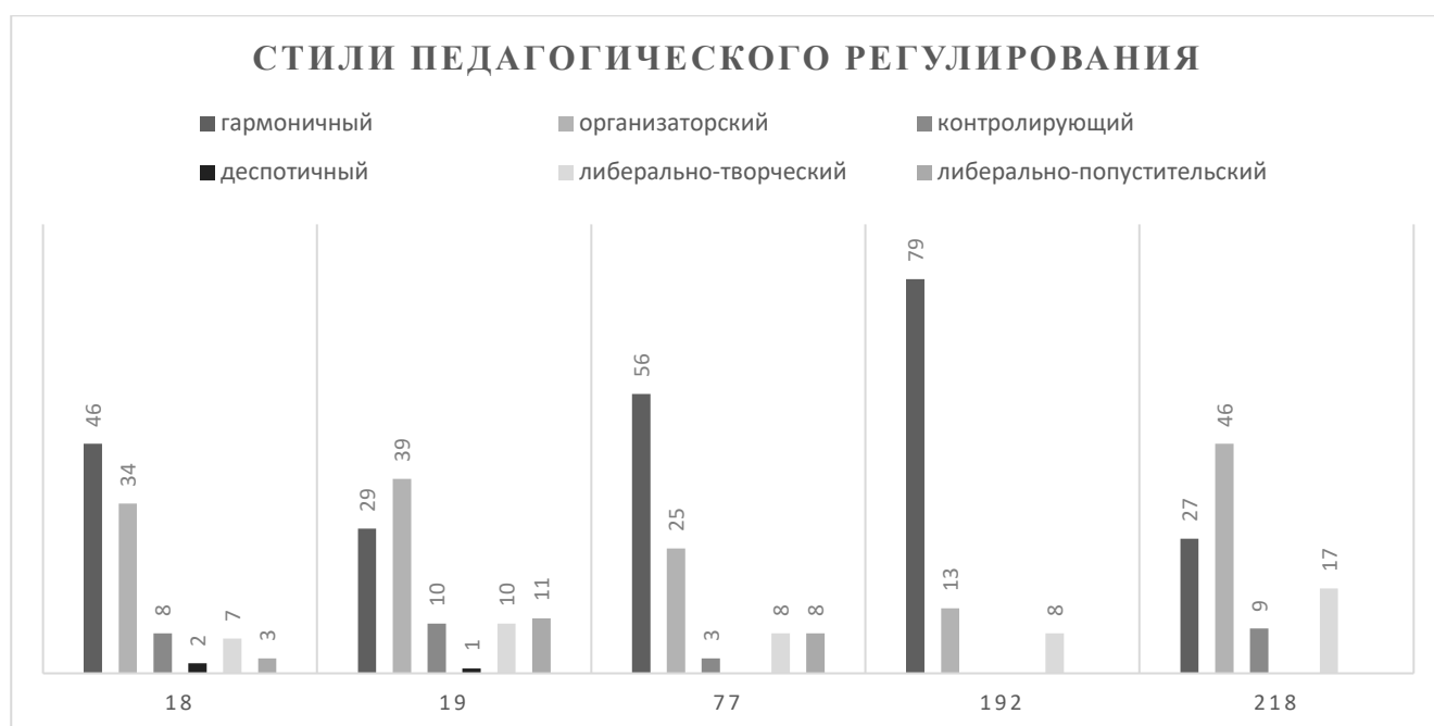
Диаграмма 1. Стили педагогического регулирования совместной изобразительной деятельности детей (по детским садам)

Результаты изучения преобладающих стилей педагогического регулирования совместной изобразительной деятельности воспитателями детских садов представлены в диаграмме 1.