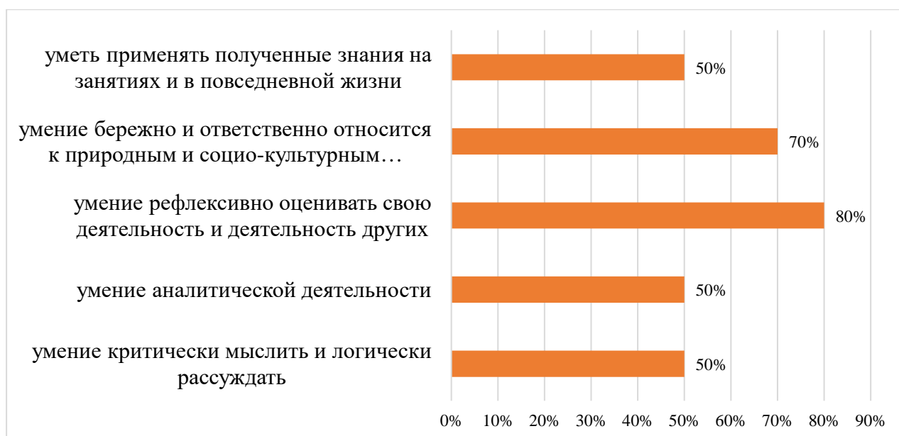
Рис. 5. Результаты промежуточного контроля сформированности эколого-правовых умений, %

В ходе практико-ориентированных занятий 50% обучающихся научились применять полученные знания на практических занятиях, 80% умеют рефлексивно оценить свою деятельность, 50% умеют логически рассуждать. Однако остается достаточное количество обучающихся, у которых умения сформированы слабо (рис. 5).