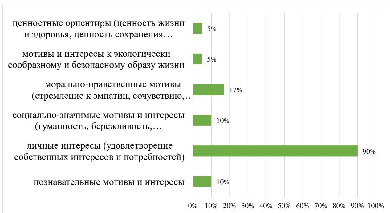
Рис. 3. Мотивы, интересы и ценностные ориентиры у обучающихся 8-го и 9-го классов, %

У большинства обучающихся преобладают личные мотивы и интересы, проявляющиеся в удовлетворении собственных интересов и потребностей (рис. 3). В целом, 90% обучающихся личные интересы ставят превыше общественных, пренебрегают правилами поведения, установленными нормами морали и нравственности. Около 40% склонны к девиантному поведению (склонны к агрессивному поведению).