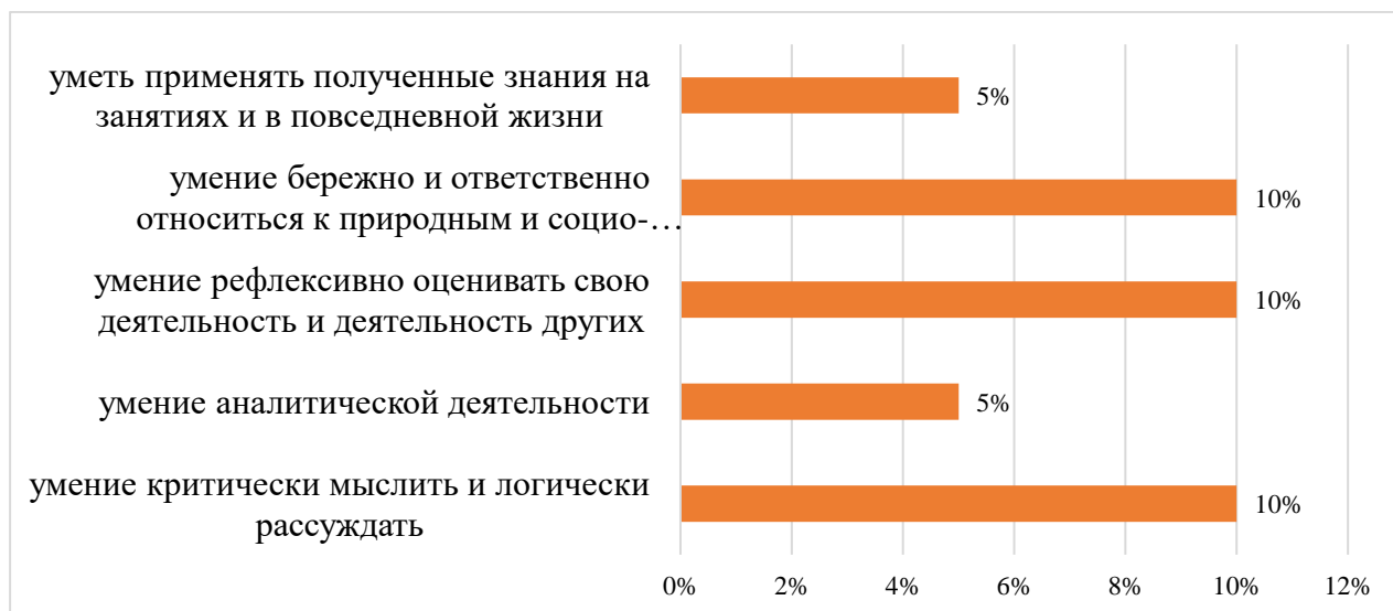
Рис. 2. Уровень умений у обучающихся 8-го и 9-го классов, %

Первоначальный уровень умений у учащихся низкий, у большинства снижены познавательные, социально значимые, а также морально-нравственные мотивы, которые определяют направленность деятельности личности (рис. 2 и 3).