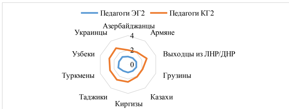
Рис. 2. Результаты Шкалы социальной дистанции (Э. Богардус) педагогов экспериментальной и контрольной групп после эксперимента в виде лепестковой диаграммы

Согласно данному графику, мы видим разницу на одну сокращенную единицу дистанции у педагогов экспериментальной группы. При этом наблюдаем сохранение дистанций у групп таджиков, туркмен, узбеков и украинцев, а также настороженное отношение к гражданам из ЛНР и ДНР.