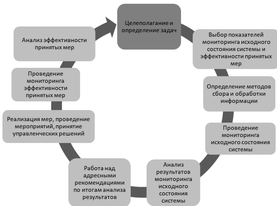
Рис. 1. Полный управленческий цикл реализации механизмов управления качеством образования [9]

Таким образом, показатели играют существенную роль в описании процессов гармонизации. В современной отечественной системе управления такими показателями являются показатели мониторинга исходного состояния системы и эффективности принимаемых мер (рис. 1).