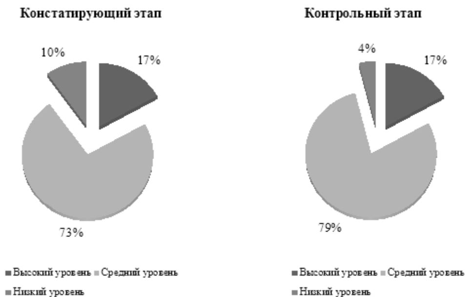
Рис. 1. Результаты диагностики по методике М.И. Шиловой, %

Результаты исследования и их обсуждение. По итогам экспериментальной части исследования, полученным в результате фиксирования исследуемых показателей на констатирующем и контрольном этапах педагогического эксперимента, сравнительного анализа, статистической обработки данных и их интерпретации, были представлены достижения обучающихся, относящиеся в большей степени к интеллектуальной либо нравственной сферам студентов. На рисунках 1, 2 отображены значения показателей, полученные при проведении диагностических мероприятий по методике М.И. Шиловой.