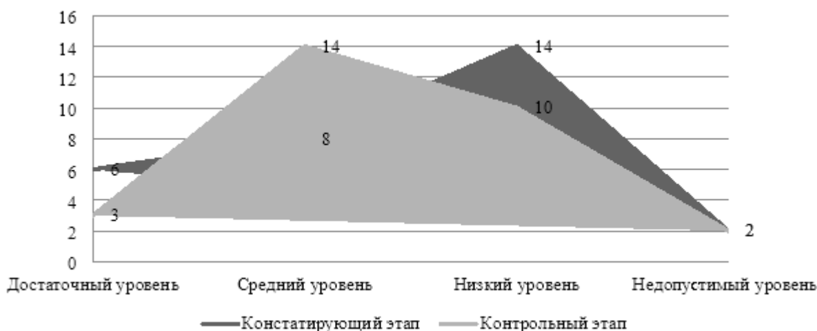
Рис. 5. Динамика результатов диагностических мероприятий по методике «Простые аналогии» на констатирующем и контрольном этапах педагогического эксперимента, чел.

Внимание к названным показателям объясняется их непосредственной включенностью в состав характеристик интеллектуальной сферы студентов. Следует обратить внимание на превалирование значений, свидетельствующих о сформированности в большинстве случаев среднего уровня искомых показателей (48% от общего числа студентов).