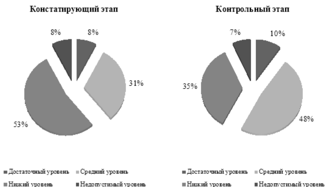
Рис. 4. Результаты диагностики по методике «Простые аналогии», %

На рисунках наглядно отображены текущие значения, зафиксированные в рамках педагогического эксперимента на его констатирующем и контрольном этапах. Диагностический инструментарий позволил нам выявить динамику изменений, выраженную через значения показателей логики и гибкости мышления студентов – участников экспериментальной составляющей исследования.