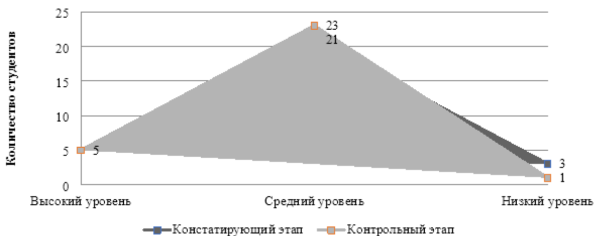
Рис. 2. Динамика результатов диагностических мероприятий по методике М.И. Шиловой на констатирующем и контрольном этапах педагогического эксперимента, чел.

По результатам сравнительного анализа, статистической обработки данных и их интерпретации, зафиксированным в процессе реализации диагностических мероприятий по методике М.И. Шиловой, можно сделать промежуточный вывод, согласно которому по окончании реализации формирующего этапа исследования, при введении авторской программы эковолонтерской деятельности в соответствии с тремя направлениями (научная, воспитательная, нравственная), преобладающим стал средний уровень развития нравственной воспитанности при сохраняющейся положительной динамике.