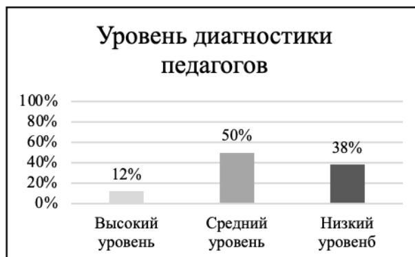
Рис. 1. Уровень готовности педагогов к организации работы по формированию профессиональных компетенций в области патриотического воспитания студентов, обучающихся по профилю «Дошкольное образование»

педагогов к организации работы по формированию профессиональных компетенций в области патриотического воспитания студентов (рис. 1).