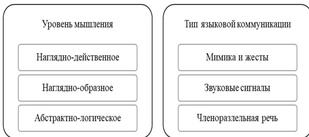
Рис. 1. Взаимосвязь уровня мышления и типа языковой коммуникации

Очень важно обратить внимание студентов на вопрос о взаимосвязи сознания, мышления и языка. Язык как знаковая система, позволяющая осуществлять коммуникацию, становится способом реализации разных типов мышления, равно как и способом существования сознания. Процессы эволюции мышления и языка в рамках антропосоциогенеза проходят одновременно, сопровождаясь усложнением структуры головного мозга и формированием речевого аппарата. Каждому типу мышления соответствует свой тип языковой коммуникации (рис. 1).