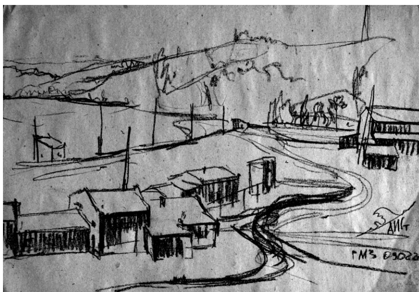
Рис. 2. Сухарев А.И. Гурьевский металлургический. Бум., уголь. 2022 г.

При работе рисовальным углем используют два основных способа ведения рисунка. Первый способ – это рисунок, в основе которого лежат линия и штрих (рис. 2). Такой способ дает рисунок похожим на изображение, выполненное карандашом. Рисовальный уголь позволяет получать линию различной тональности и толщины; чтобы получать тонкие линии, необходимо затачивать уголь наждачной бумагой под углом 45^\circ в основании палочки.