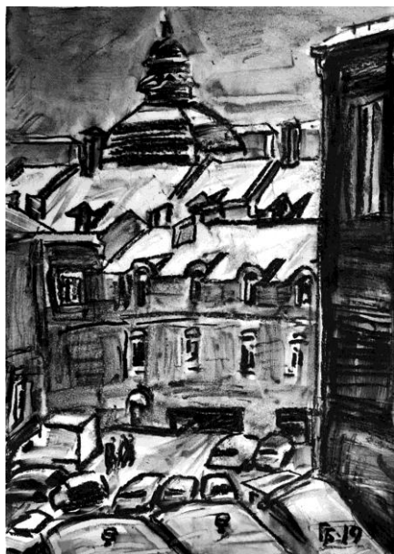
Рис. 3. Баймуханов Г.С. Дворик на ул. Партизанской. Бум., уголь 2019 г.

или нарисована с одинаковым нажимом, то работа выглядит как раскраска, будет монотонной и неинтересной [6].