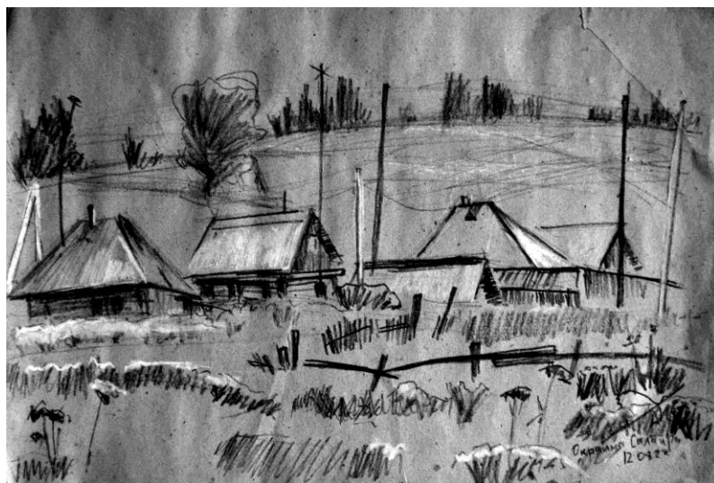
Рис. 4. Сухарев А.И. Салаир. Бум., уголь, мел. 2022 г.

С помощью рисовального угля можно чередовать тоновые отношения, прозрачность, воздушную перспективу, светотень. Он хорошо передает объем, переходы от одной тональности к другой от самого плотного, темного до белого тона бумаги.