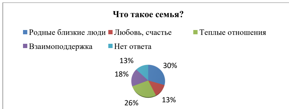
Рис. 3. Результаты ответов на вопрос: «Что такое семья?»

13%, не ответили – 13%. Такие результаты говорят о том, что дети в основном правильно представляют семью как социальный институт, где живут рядом родные и близкие, понимая и поддерживая друг друга. Почти на одинаковой позиции находятся «Любовь и счастье» и «Не понимают или не знают, что такое семья» – по 13% опрошенных, что говорит о неполноценности семейных взаимоотношений.