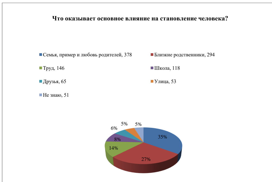
Рис. 5. Результаты ответов на вопрос: «Что оказывает основное влияние на становление человека?»

внимания со стороны окружающих людей, что показывает отчуждение их от общества. Здесь видны результаты слабого взаимодействия семьи и школы.