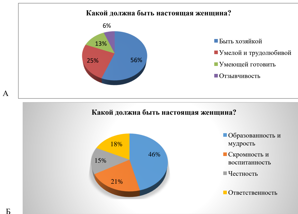
Рис.1. Результаты ответов на вопрос: «Какой должна быть настоящая женщина?»