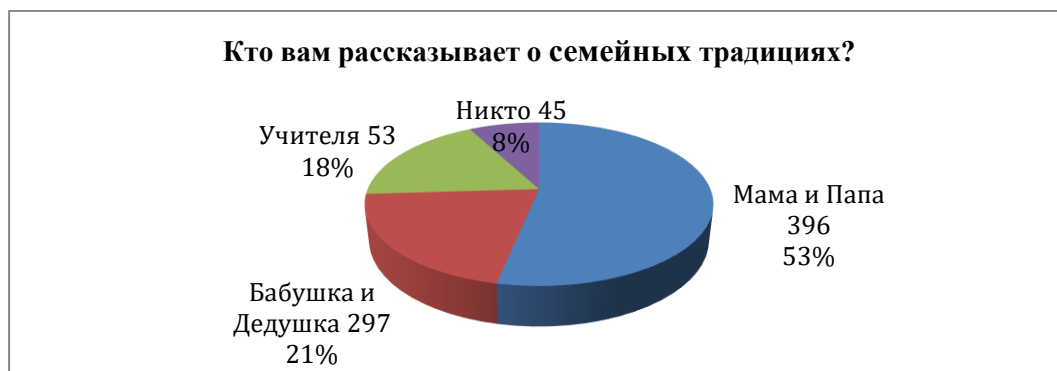
Рис. 4. Результаты ответов на вопрос: «Кто рассказывает о семейных традициях?»

На вопрос: «Кто рассказывает о семейных традициях?», ответы на который показаны на рисунке 4, больше половины детей ответили: «Папа и мама» – 396 и «Бабушка и дедушка» – 297, что говорит о преемственности поколений, о внимании родителей и старшего поколения к традициям и обычаям своего народа. Учителя оказались на третьем месте – 53 ответа, что говорит о незначительной роли учителя в подготовке к семейной жизни старших подростков. Получается, что 45 учащимся никто не оказывает внимания в передаче опыта предков в формировании семейных ценностей. Этим детям необходимо особое внимание, привлечение к занятиям в кружках и секциях, к деятельности в детских и молодежных движениях.