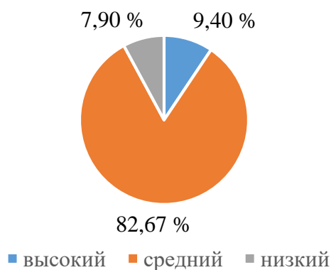
Рис. 2. Результаты опроса студентов ФФКСиТ по субшкале «Социальная толерантность»

Последняя субшкала «толерантность как черта личности» позволяет диагностировать черты личности, убеждения и установки респондента, определяющие его отношение к окружающему миру. Как и по первым двум шкалам, здесь преобладают респонденты со средним уровнем (60,6 %), больше трети респондентов (38,6 %) показали высокий уровень, и лишь малая часть (0,8 %) обладает низким уровнем (рис. 3).