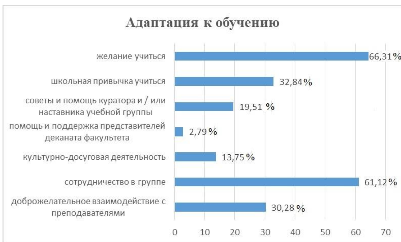
Рис. 3. Кто (что) помогает адаптироваться к обучению?

При анализе поиска решений возникающих проблем подавляющее большинство студентов понимает, что успехи в обучении зависят от них самих – от их отношения к учебе и от количества прилагаемых усилий (66,31%). Желание учиться, создание в группах благоприятной атмосферы, духа сотрудничества, доброжелательное взаимодействие с преподавателями, кураторами групп – все эти факторы отмечены респондентами как благоприятные для их адаптации к новым условиям обучения в университете. Не менее важной для адаптации первокурсников является сформированная школьная привычка учиться (32,84%). Процесс формирования общеучебных умений в школе определяет и способность обучения на следующих этапах образования, какой бы специфики они ни были. Правильно сформированные школьные навыки помогают быстрее и легче адаптироваться к учебной деятельности в новых условиях (рис. 3).