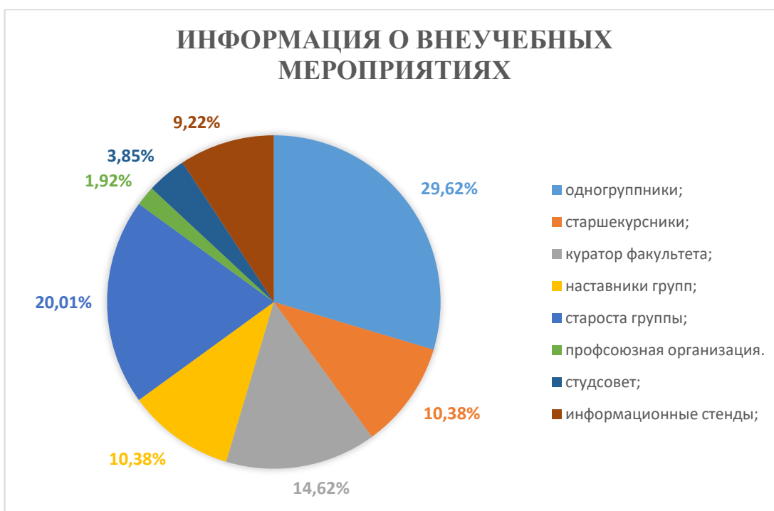
Рис. 5. Из каких источников Вы получаете информацию о внеучебных мероприятиях?

Важную роль в формировании коллектива выполняет внеучебная работа, которой в ОмГМУ уделяется большое внимание. Организуется она по разным направлениям, а выбор мероприятий и форм участия зависит от информированности обучающихся. Самыми востребованными источниками информации о проводимых мероприятиях являются одногруппники (29,62%), старосты групп (20,01%), кураторы факультета (14,62%), а также наставники и старшекурсники ОмГМУ (10,38%) (рис. 5). К сожалению, профсоюзная организация, студенческий совет и информационные стенды пользуются наименьшей популярностью у студентов. В настоящее время студенты предпочитают получать информацию путем общения со своими друзьями или через социальные сети.