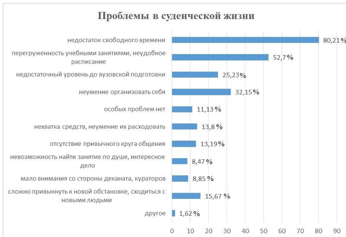
Рис. 2. Что вызывает наибольшие проблемы в студенческой жизни?

Необходимо отметить, что часть студентов (17,69%) и после первого года обучения отмечает, что они испытывают некоторые проблемы в освоении дисциплин, и в обучении в целом. Это вполне естественно, так как адаптация – это процесс длительный и сугубо индивидуальный, зависящий как от внешних, так и от внутренних факторов, и проходящий у каждого студента индивидуально.