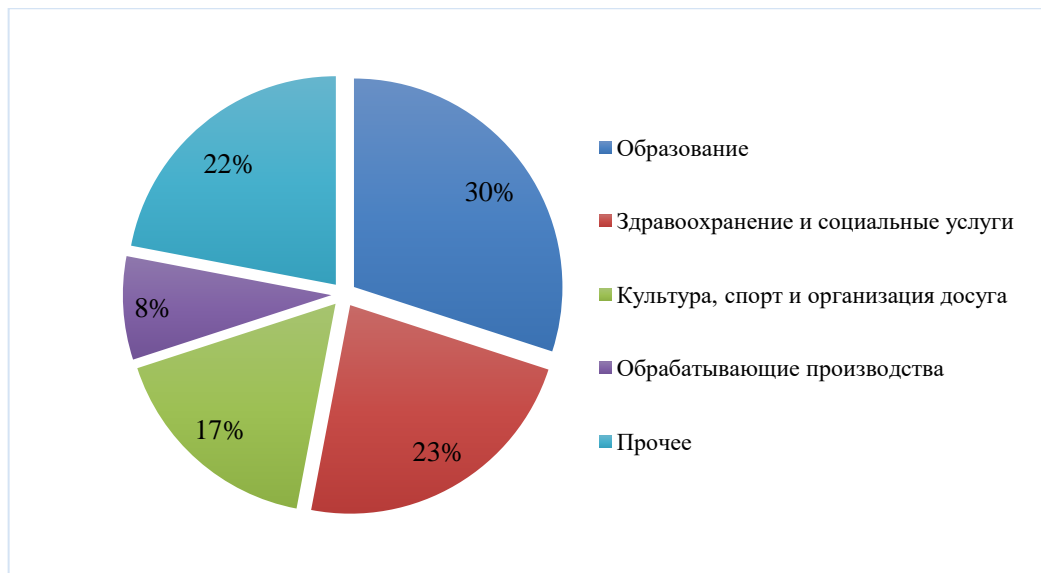
Рис. 1. Отраслевой разрез деятельности социальных предпринимателей в России по данным на январь 2024 г., %.