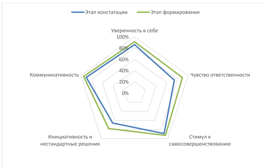
Рис. 2. Развитие субъективных качеств студентов, вовлеченных в проектную деятельность

Примечание: составлено авторами на основе полученных данных в ходе исследования.